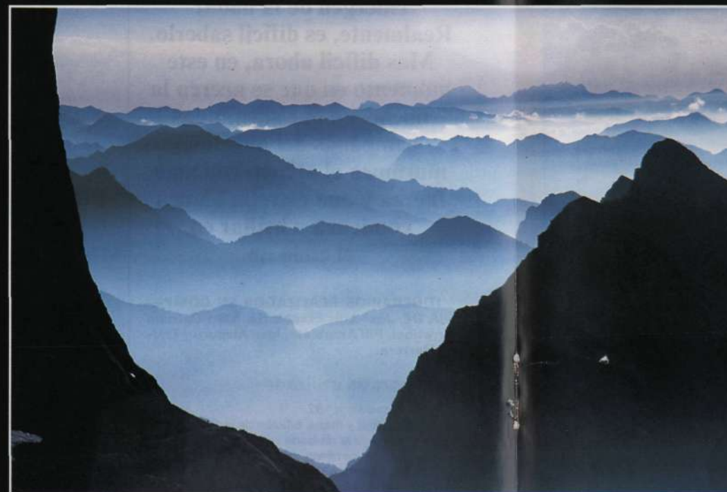
HORIZONTES LEJANOS Cordillera Cantábrica desde Ario