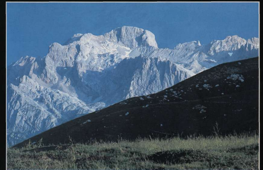
CUMBRES BORRASCOSAS Torre Bermeja desde la Collada de Valdeón