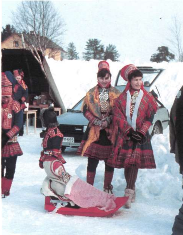
Fiesta lapona ▶ en Enontekio.

Otsailak 5 ean irten ginen Tolosatik (iñauteri igandea). Bi kotxetan sei lagun beste hainbeste bizikleta eta ekipai guztia sartuta abiatu ginen Frantzia, Belgika, Alemania eta Dinamarka egun pare batetan zeharkatu Suedian sartzeko eta gero Baltiko itsasoa ferry batetan pasa eta Suomin (Finlandia) lasaiago ibiltzeko aukera genuen. Otsailak 14 ean KEMI izeneko herrira iritsi (Botnia golkoan) eta etxetik 4.000 km trotara dagoen puntu honetatik hasiko ginen bizikletaz iparralderuntz 800 km. gorago dagoen Norkappera heltzeko asmoz.