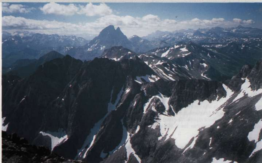
Desde la cima el dominio visible es extenso.

Si te aplicas en el mapa, comprenderás que la elección de esta ruta posibilita el conocimiento de unas montañas silenciosas y un tanto descuidadas por los montañeros. Aquí se conjugan los bosques, lagos, nevados, contrafuertes y barras rocosas con zonas pastizales surcadas por senderos. Todo ello adicionado resulta un itinerario en círculo y motivo ideal para emprender el camino.