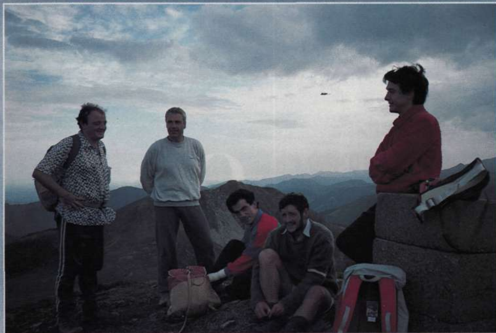
«Los puretas de Pyrenaica».