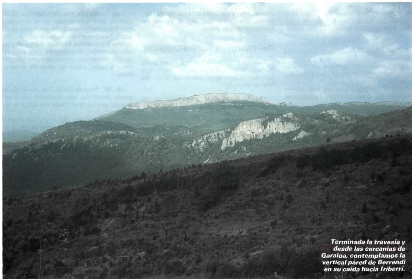
Terminada la travesía y desde las cercanías de Garaioa, contemplamos la vertical pared de Berrendi en su caída hacia Iriberrí.

La sierra, en esta primera parte del recorrido, presenta un gran contraste entre el am-