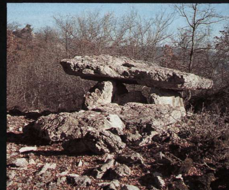
Dolmen de Artzabal situado en la zona sur de la sierra.