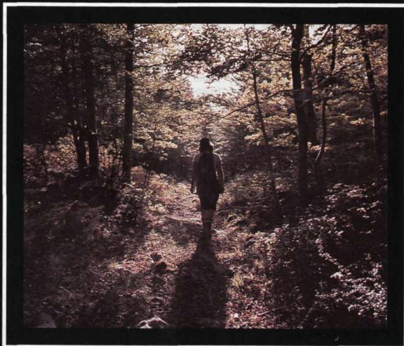
Los bosques invitan al paseo