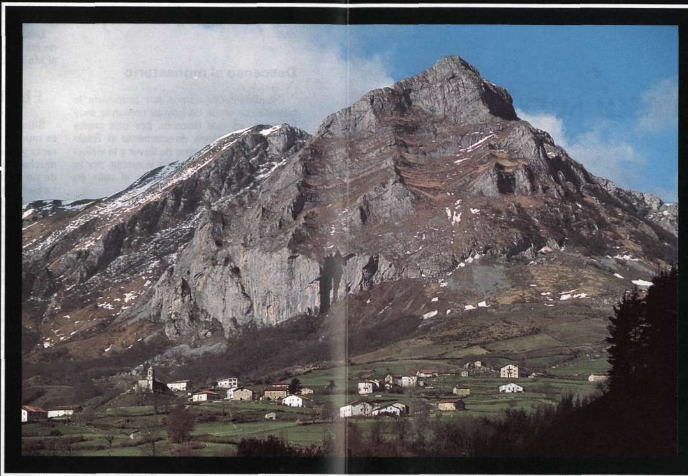
Mallo Zar (Balerdi)