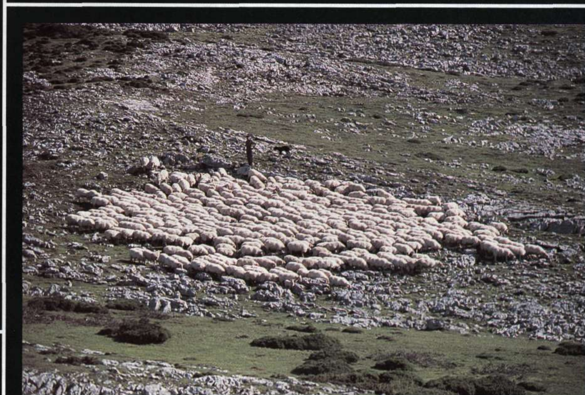
Rebaño de ovejas en la zona de Maantza