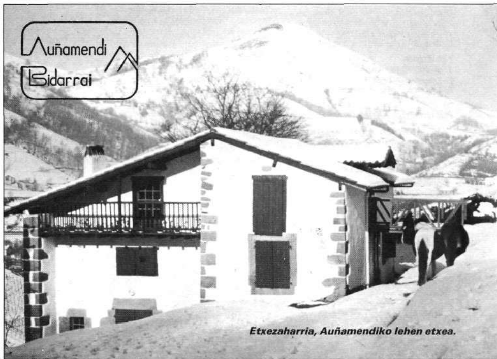
Etxezaharria, Auñamendiko lehen etxea.

Bere iharduerarik garrantzitsuenetariko bat urteroko Ibilaldi Arautua da; Euskal Herri guztiko alpinistak joaten dira bertara, XV. Ibilaldia dugularik.