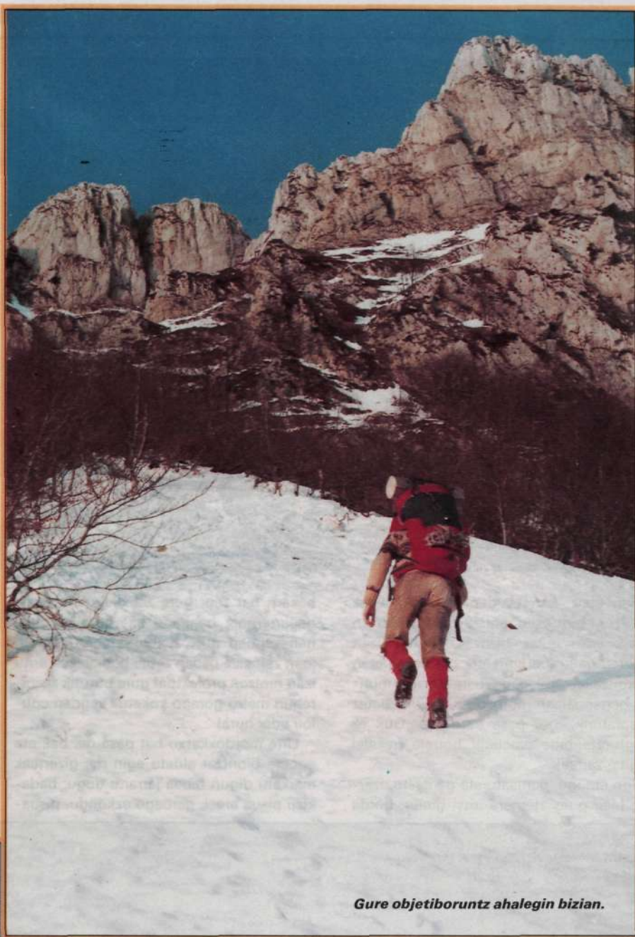
Gure objetiboruntz ahalegin bizian.

Otzaurteraino doan karreteratik apartatuz, pistan, hainbeste aldiz ibilitako pista aldapatsu hartan, gure botak jarri genituen. Bertako beserrietako jendearen begietan harridurazko susmo bat igartzen nuen; ez zituzten ulertzen gure arrazoiak hāra joateko, zibilizazioren erosotasunak