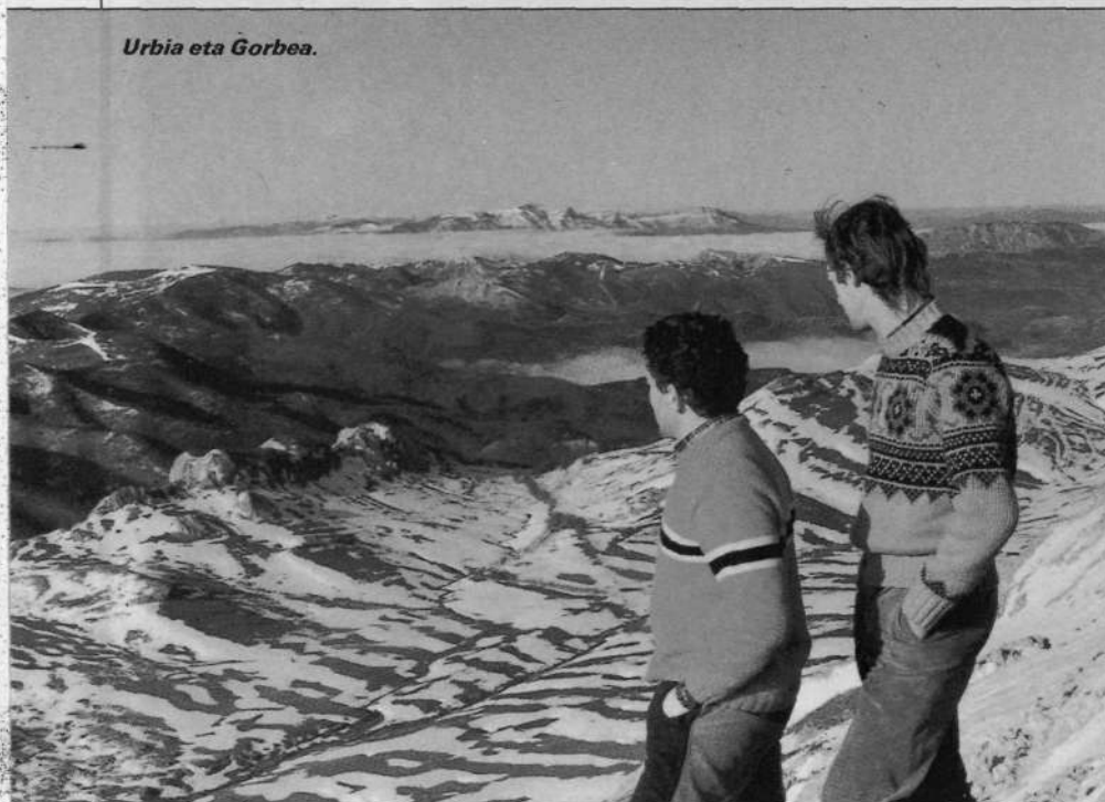
Urbia eta Gorbea.

hirian utziz. «Arratsaldeon» ozenki batez agurtzen gintuzten, gauza asko galdetzen hitzik esan gabe; bizitzak, horrela izan erazten gaitu; bai hirietan, bai baserrietan bakoitza bakarrik dago, bere barruko mundu pertsonalean murgilduta, harresi batez inguraturik, inor pasa ez dadin. Guk ez dugu irtenbide ematerik horrela irakatsi digu gizarteak.