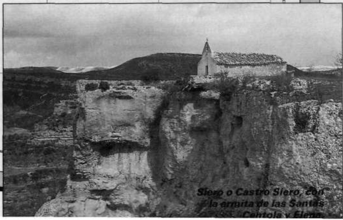
Sierra o Castro Siero, con la ermita de las Santas Cecilia y Elena.