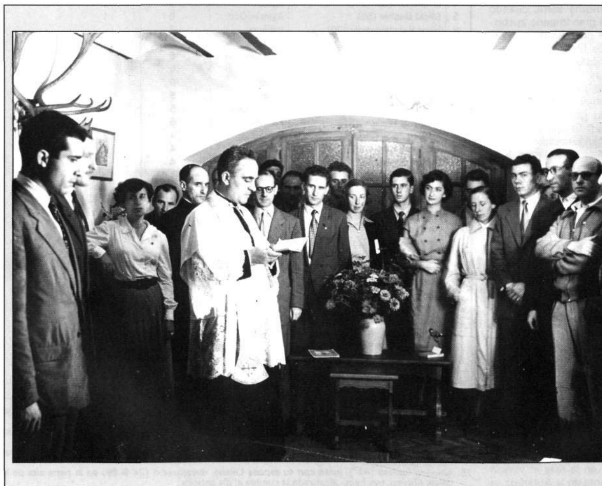
Año 1950. Acto de inauguración del Club.