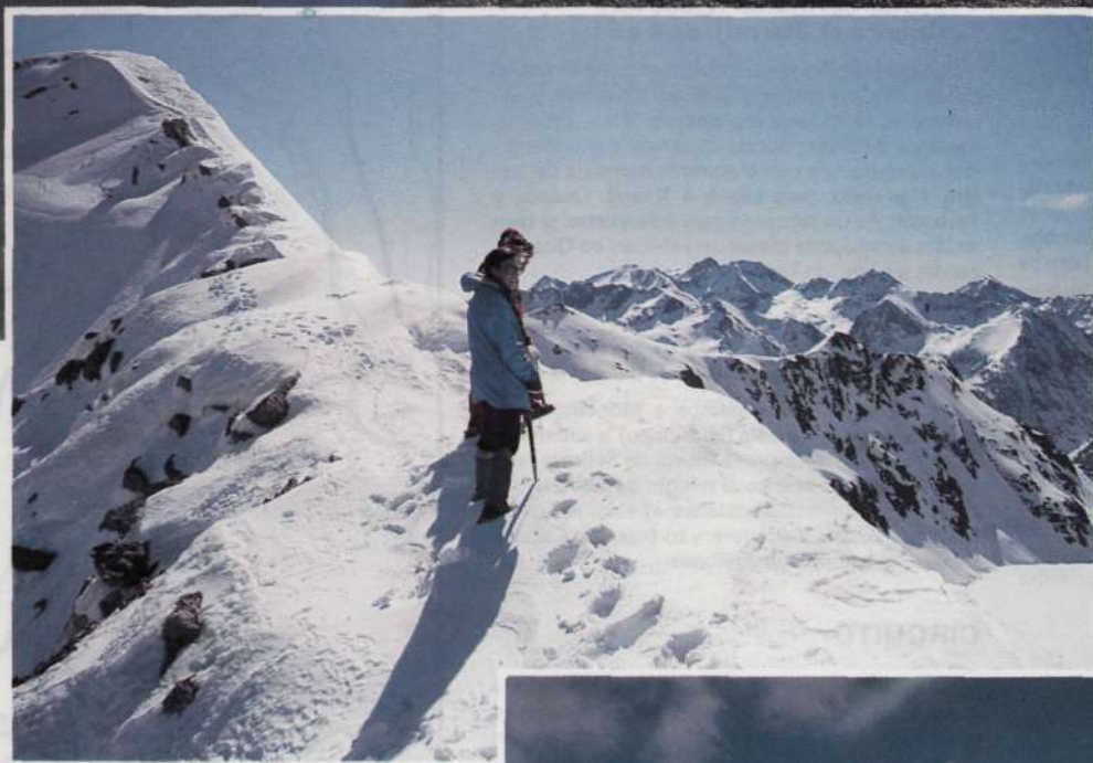
Tramo final en la cresta del Pic de Senó por el itinerario 3.