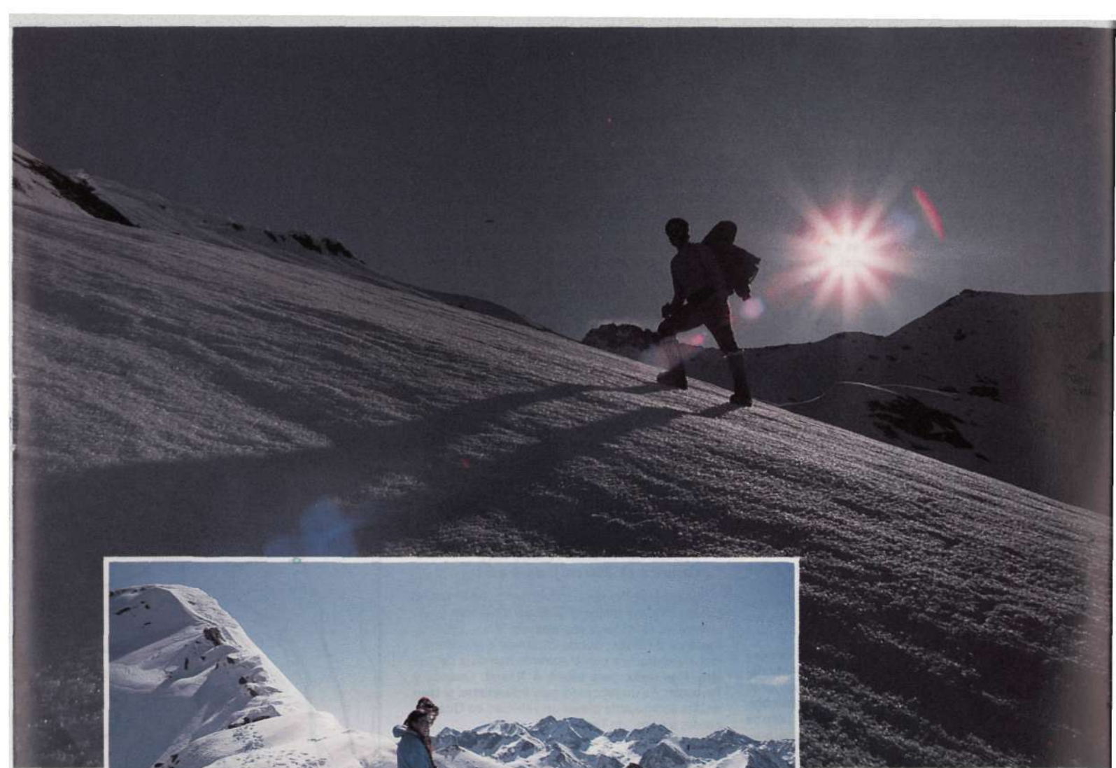
Ascenso al Pic de Senó.