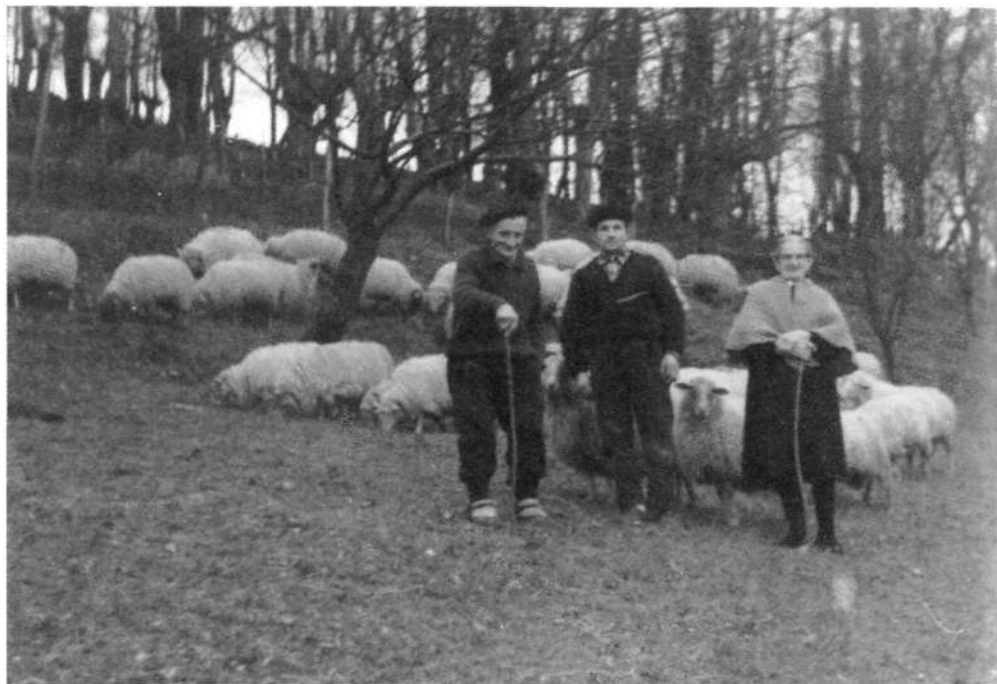
Aitzioko artzai-artzaintsak ardiei ezin eutsiz.

«Hementxe nator berriro hemen txango motzeko laguna Larogei eta hamar egunez ortziaren txapelduna Nondik natorren ez dakit baina sorrera ez dut urruna Udazkenaren amodioak dauka horren erantzuna»