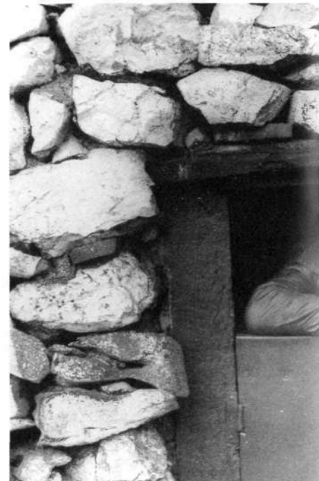
Aide honekin larrea urri.

«Gu hemen gaude urte guztian eta zu zatoz erromes Urtearoen purrustaldiak ezin gaitzake gu babes Goitik zerua behetik berriz auskaloko zenbait ames Denak gugana erakartzea ez zaigu bat ere errex»