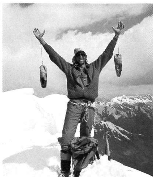
Cima del Chinchey.