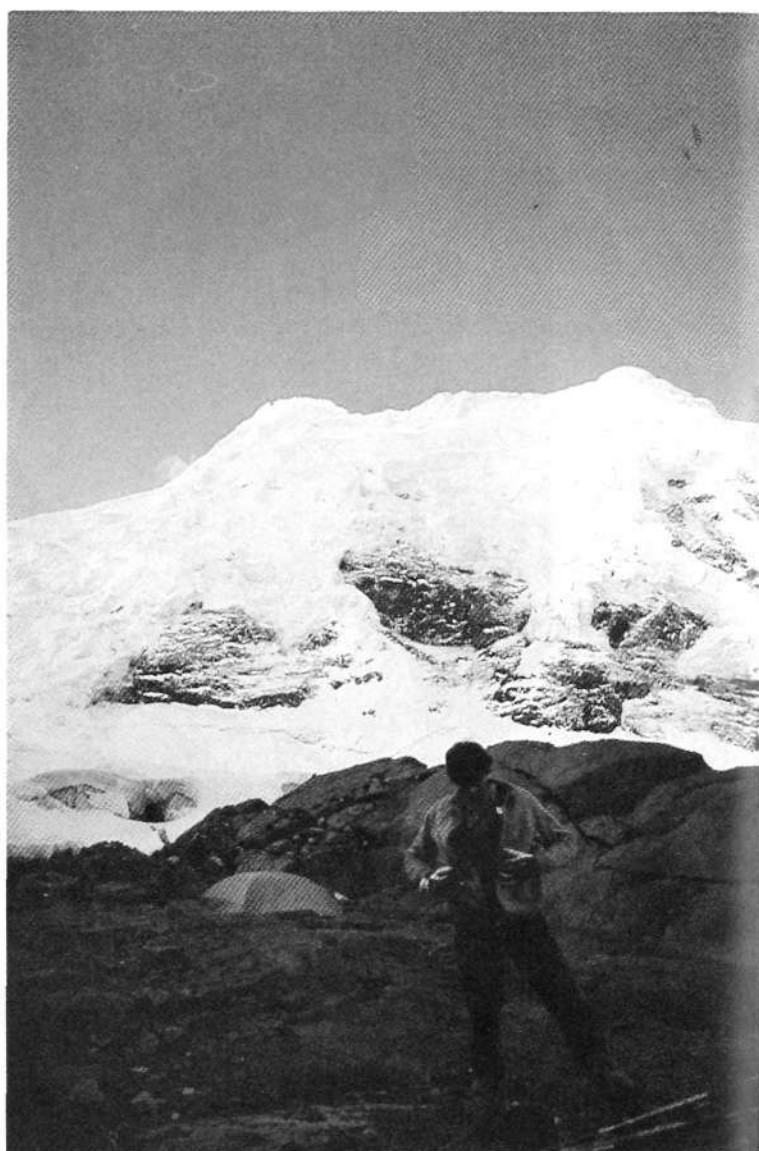
Chinchey desde los 5.100 m., lugar donde emplazamos las tiendas.

El grupo Chinchey, el más extenso de la Cordillera Blanca, situado en el departamento de Ancash, al E. de Huaraz, contiene 5 cumbres de más de 6.000 metros, la más alta de las cuales es el Nevado Chinchey (6.309). El principal acceso a la sierra es por la Quebrada Honda al N., una zona de minas de carbón abandonadas.