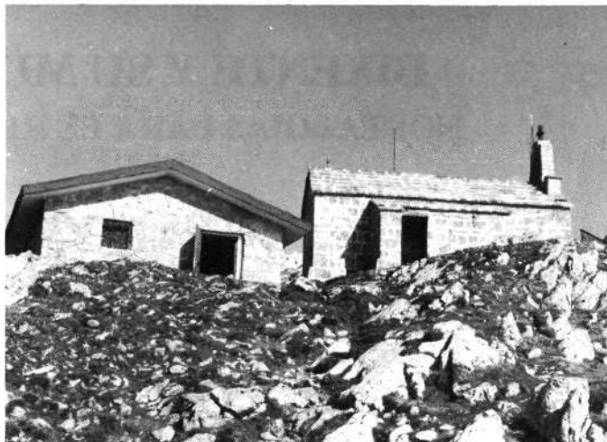
El refugio y la ermita de Aitzkorri. Un conjunto reconstruido que ha sido inaugurado en setiembre.