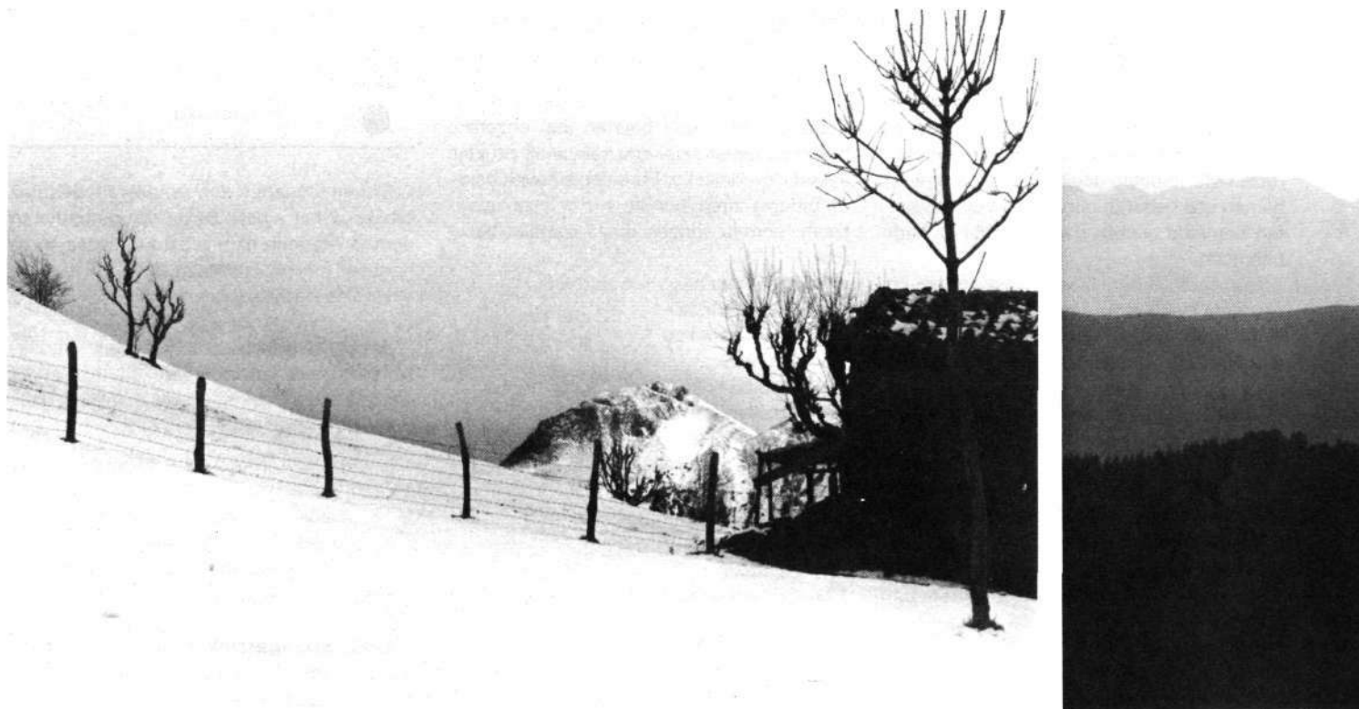
Loibe - Arantzamendi - Aizkorri.