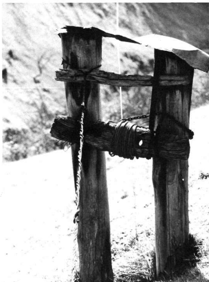
Belarririk gabeko «Astoa».

Kokaketa: Ataungo Elabarrena auzoa abiapuntu bezala, Iztatorren harrobirako bidea hartu behar da, eta han ditugu gure aurrean Aizarteko Mailoak. Hala ere, beste bi sarrera baditu auzo honek, bata Gurutzeberri deritzaion puntutik eta bestea Kobadi zeharretik Aralegiko zelaia.