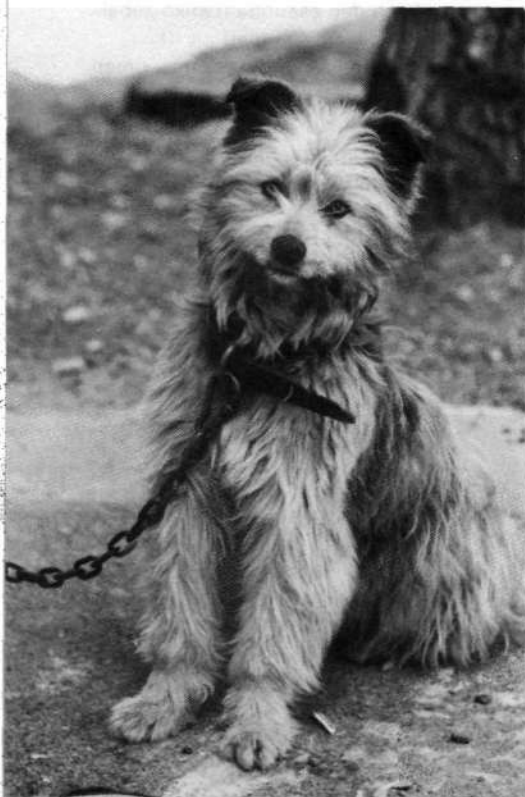
Aitzio goiko artzakurra.

4.—Elbarrena - Arloska - Gutza - Aiztondo - Andravideta - Jentilbaratza - Aizkoate - Aizkorrandi - Arastortz - Atakabiko Koba - Aleiko Zelaia - Aldasparrena - Aldatsoko Iturria - Agauzko Arratea - Leizadi - Asundi - Iruzulora - Muntxo - Ertzillegi - Beama - Olata - Loibeko Lepoak - Ikandieta - Urdano - Iran - Agerre - Elbarrena.