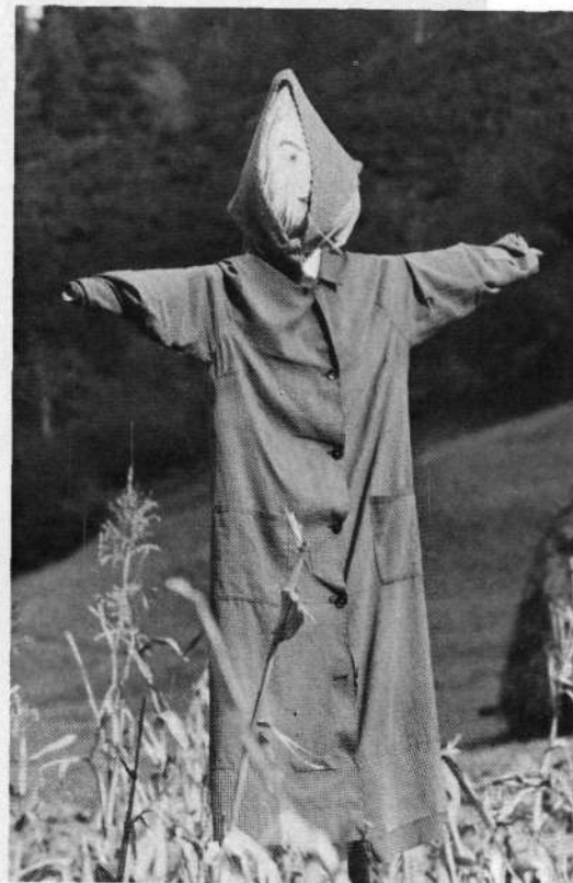
Aralegi Berriko artasoroko kusoa.

Orduan jentilek egin omen zuten esanaz: Agerre Agerre zen bitartean ez zela eririk ez makirik faltatuko.