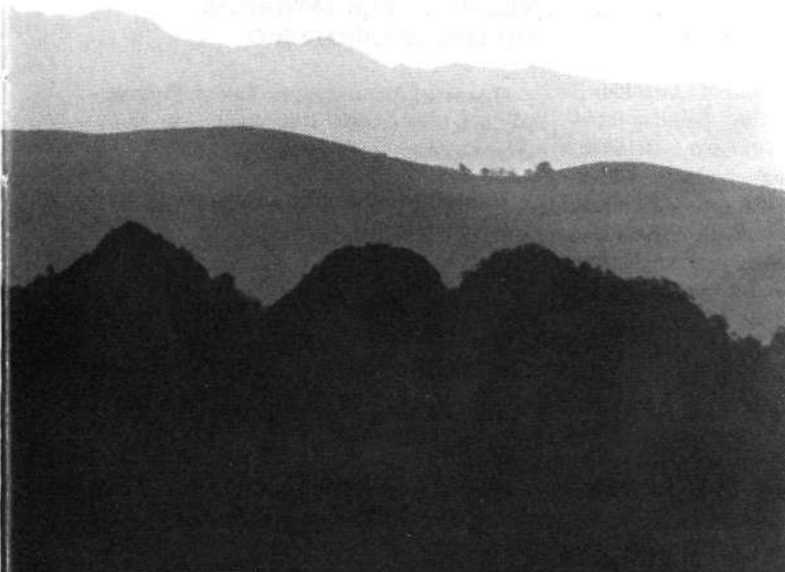
Jentila zelatan dago.

«Erremedioko neska bat neskame omen zegoen herriko ostatuen. Ostegun Santuz neska horrek, Kalbario Santuko basilizari 3 bira baietz eman apustu egin zien mutil batzuei. Baina bigarrena eman zuenean haize purrustada bat sortu eta berarekin ezkutatu zen, ondorengo hitz hauek entzuten zirela- rik: «Gaua gauekoentzat eta Kattalin gure- tzat».