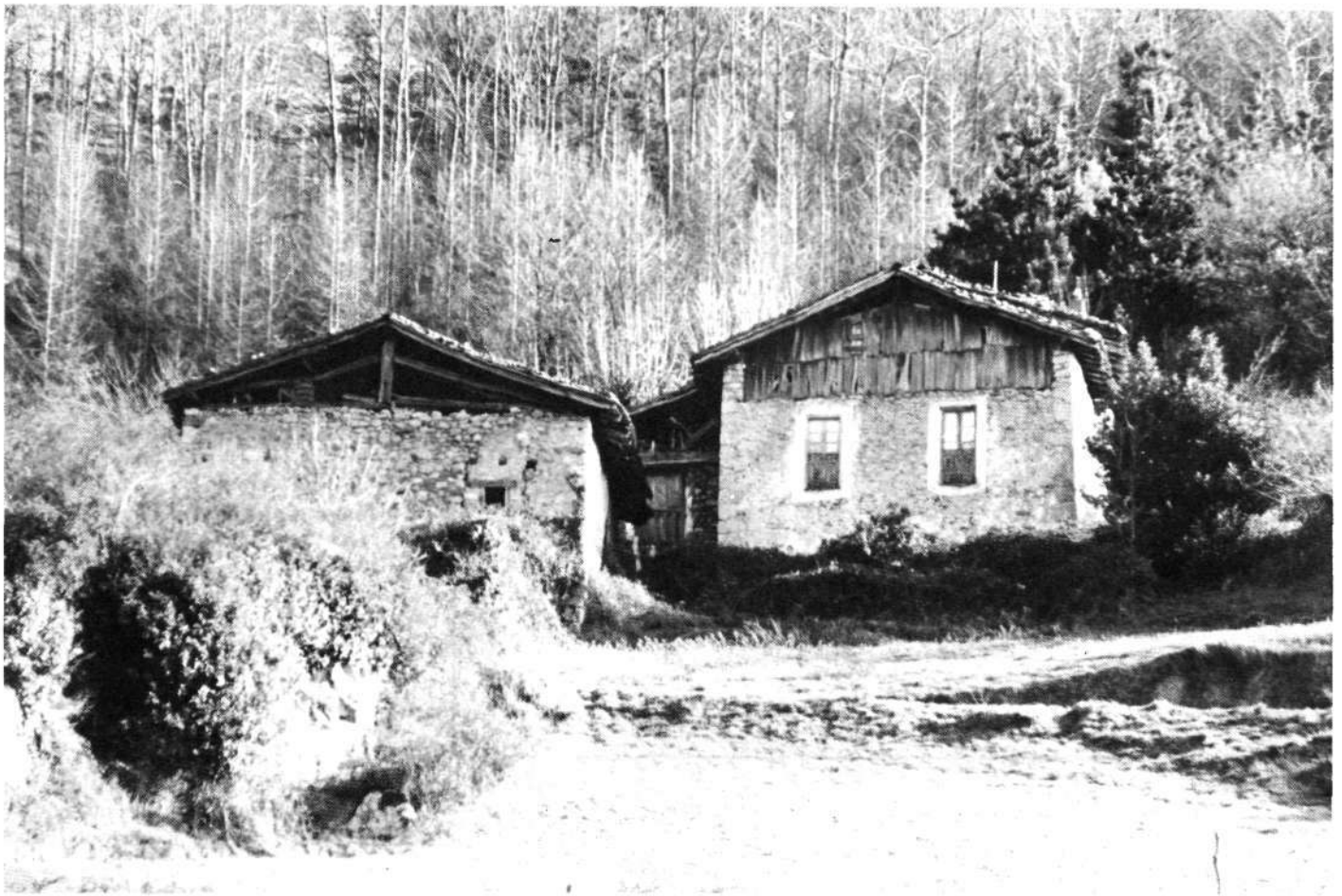
Aizkorriondo baserria hutsik.

Iturriak udan ia agorturik egon badira ere, orain bete-betea datoz lehertzen arituko balira bezala. Eta gaur nora joango gara?