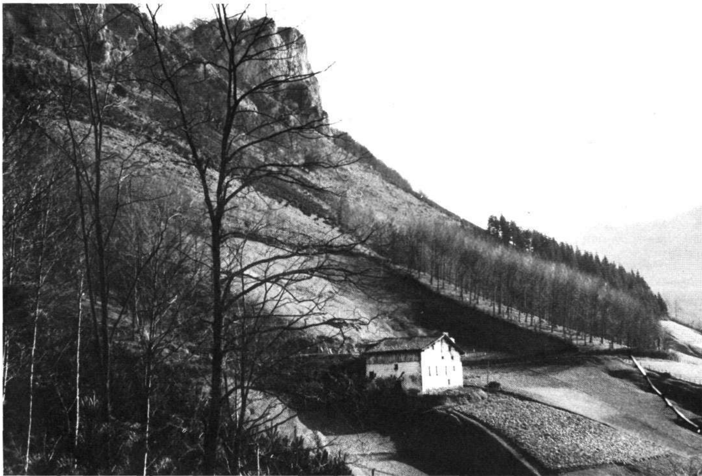
Kantxillu baserria, urrutian Sastarri.

Txahalgorriak: «Marumendiko saroieta-ko artzaiak, jaiegunez, Agauzko zelaiune batetan biltzen omen ziren elkarrekin, dantza eta festa egitearren. Haietatik hiruk harri batzu bota omen zituzten han inguruan da- goen leize batetara. Hori eginik bertatik txah-