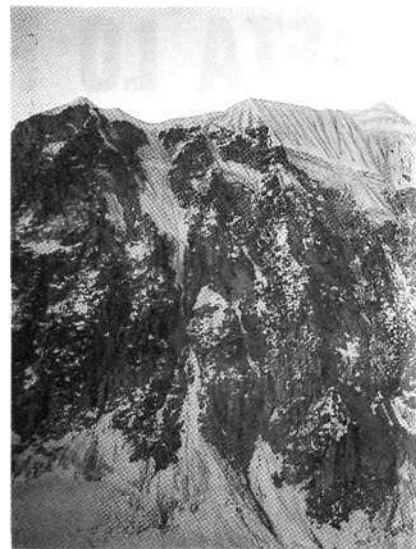
Cara Sur del pico Norte, en la Cordillera Real.