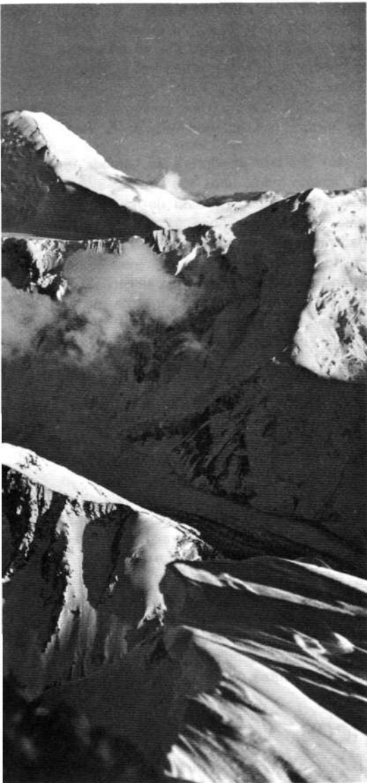
PIK KOMMUNIZMA: «Montañas de Nuestra Tierra», de Toni Hiebeler (Ed. R. Torres, Barcelona 1975) página 72

ve durante gran parte del año, lo que le hace visible desde extensas zonas de la planicie siria, incluyendo Damasco, la capital, que se encuentra 45 kms. al ENE del mismo.