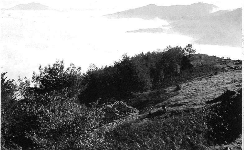
Cumbres de Peña Ituren, Mendaur y Mendi-eder.