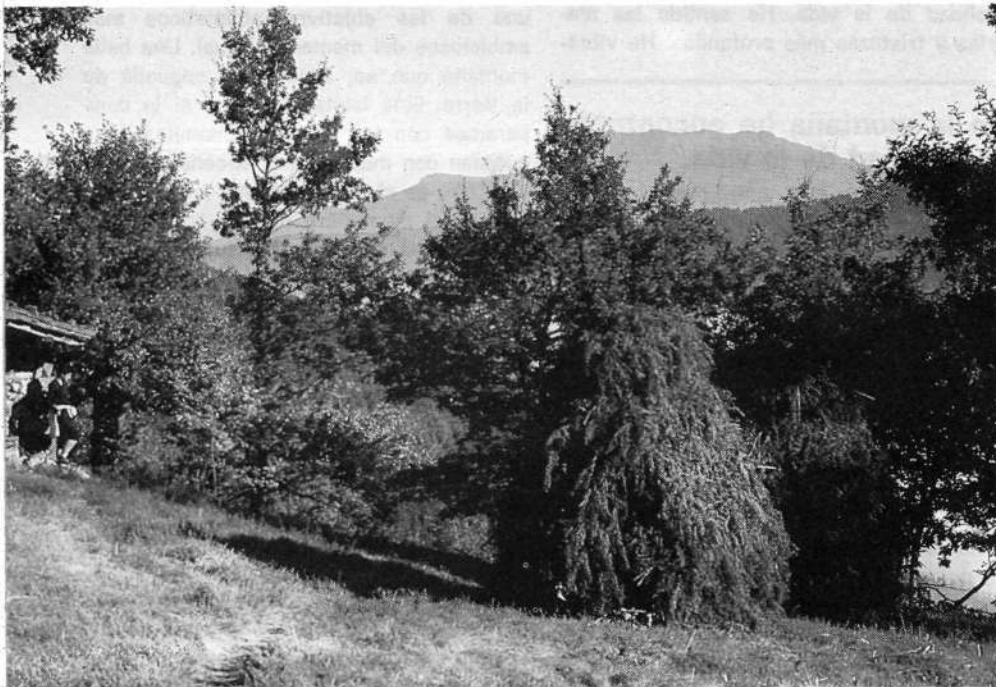
Bidasoa; al fondo, Larun.