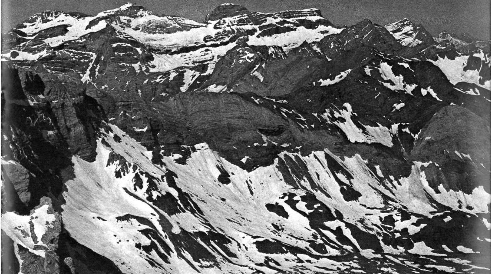
«Nuestra primera mirada fue para el Monte Perdido». Macizo de las Tres Sorores visto desde la Munia.

otra alternativa que la ladera que se yerge sobre el circo de Barrosa. Estaba cubierta por un extenso nevero que resultó más empinado de lo que en principio supusimos, así que esta vez no dudamos de la necesidad de encordarnos, pero al no disponer de piolet y crampones para todos, tuvimos que dedicar mucho tiempo a tallar huellas. Al final el nevero se convirtió en un pronunciado corredor, de modo que lo abandonamos metiéndonos en la rimaya para acabar trepando por las rocas.