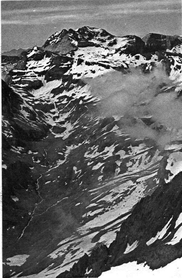
El Macizo de Troumouse contemplado del Estaragne (Neouvielle).

una torre caliza, dejándola a la izquierda para penetrar en un corredor oblicuo que no es visible desde arriba y sólo se recorre en parte, pues se desciende muy bien por las rocas de su costado izquierdo.