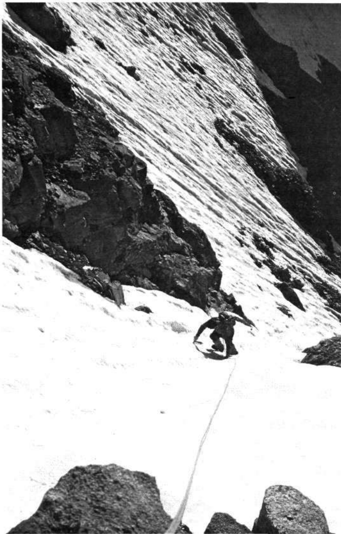
Grand Combin. Subiendo hacia el col de Meitin.