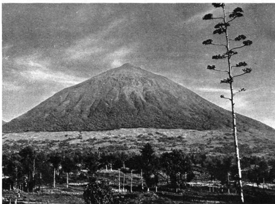
El Volcán Muhabura, 4.127 m.

las prefecturas de Kigali o Ruhengeri. No conviene entrar sin el permiso, pues corres el riesgo de que a la salida te detenga el Ejército. (Datos: agosto 1981).