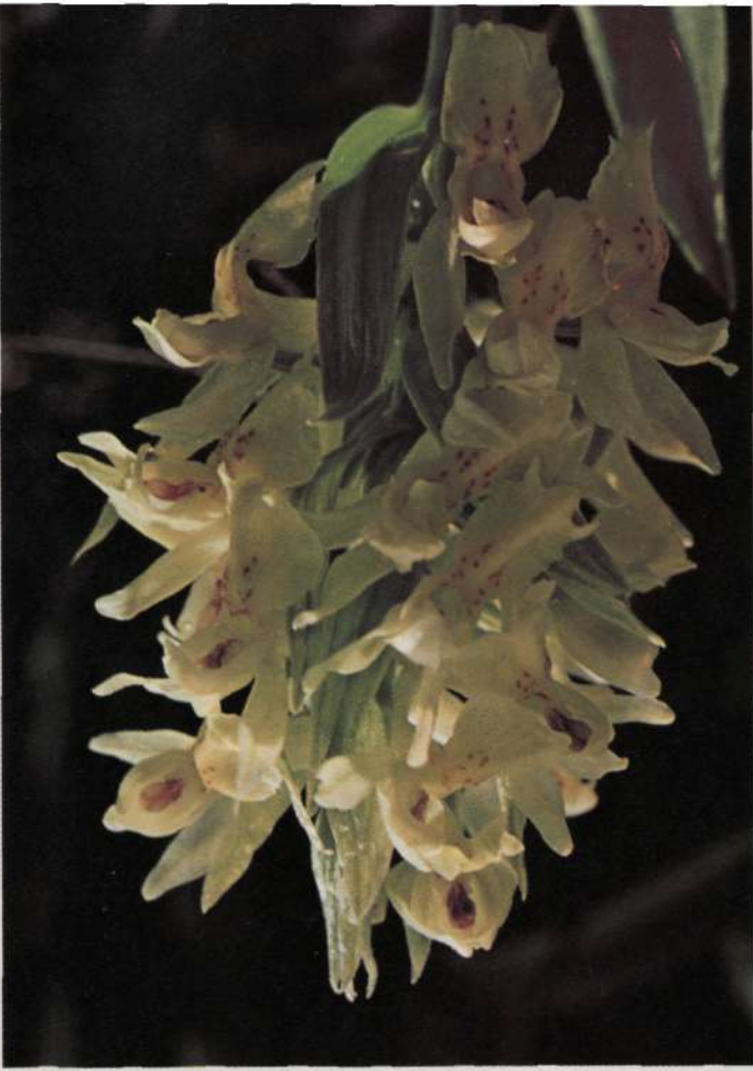
Orchis Sambucina L.