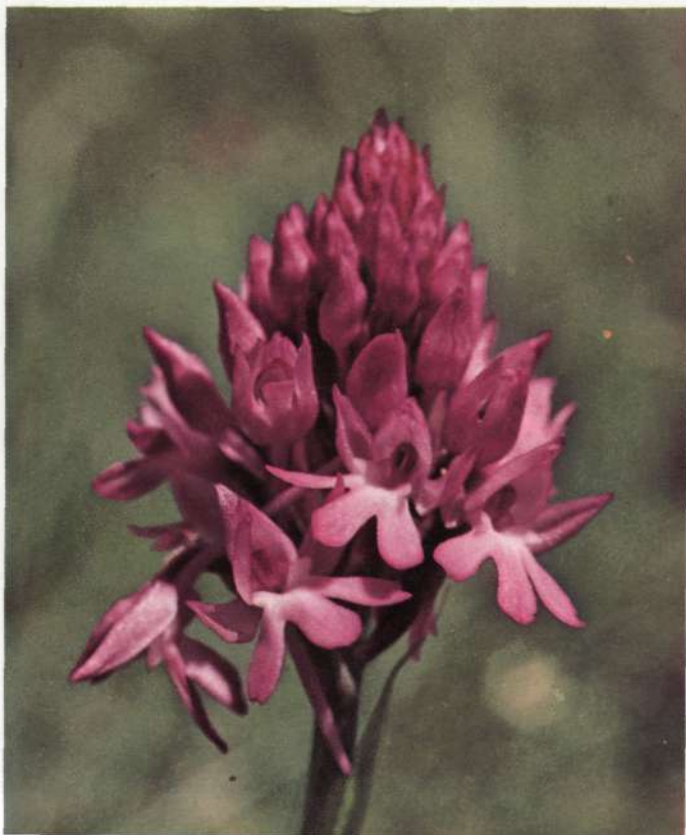
Orchis Pyramidalis L.