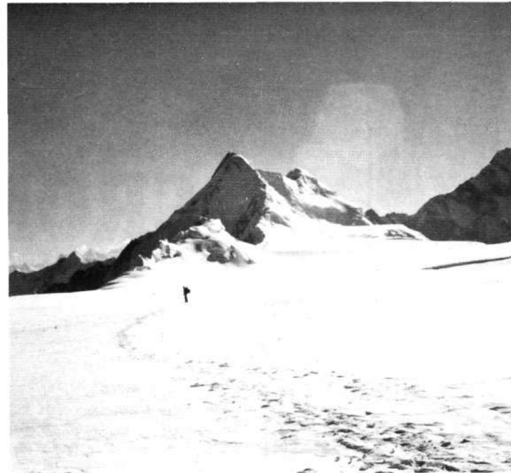
Pico del Comunismo (7.495 m.).

Nos han prometido un informe completo para el próximo número de Pyrenaica.