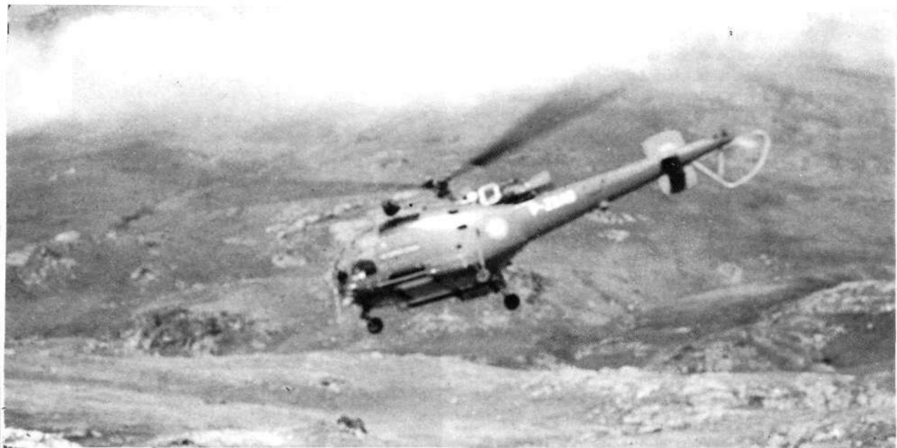
Helicóptero de la Gendarmería en Gavarnie. (Foto P. Irigoyen).

Terminados estos actos, se celebró una reunión de trabajo en Gavarnie, con asistencia de Mr. Dominé, Prefecto del Departamento de los Altos Pirineos, del Sr. Gobernador Civil de Huesca, del Cónsul Español, de los Coroneles de la Gendarmería del citado Departamento y de la Guardia Civil de Zaragoza y Huesca, de