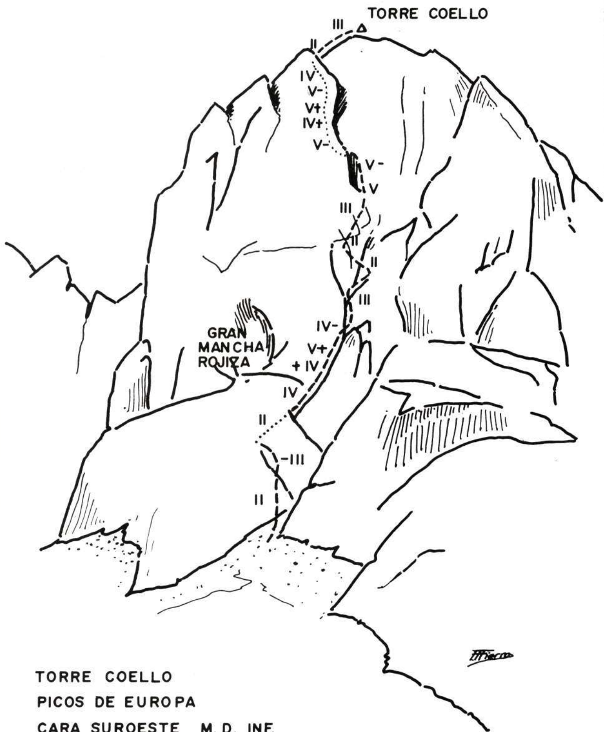
TORRE COELLO PICOS DE EUROPA CARA SUROESTE M. D. INF.