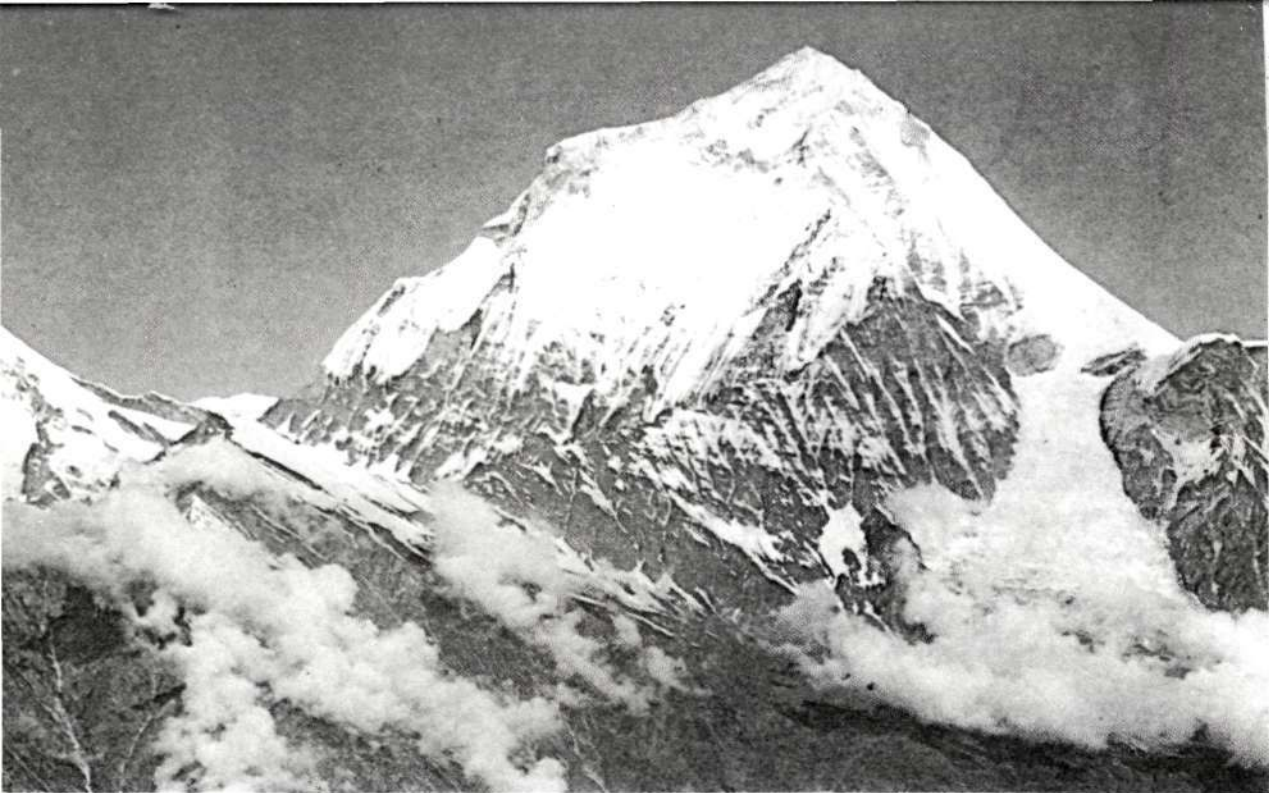
El Dhaulagiri (8.172 m.).

conquistas con el sello imborrable que nos caracteriza. Esto nos hace sentirnos seguros para emprender la gran aventura del Himalaya.