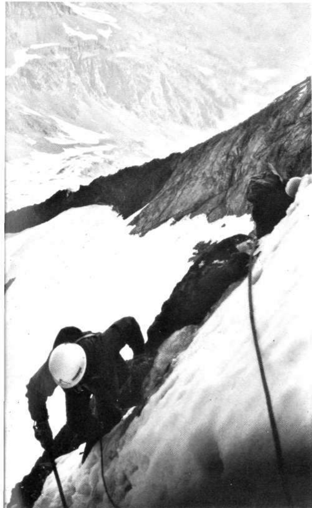
Saliendo a la cresta cimera.

vez en cuando alguna piedra rueda pendiente abajo y aumenta el número de la pedrera donde nos encontramos, del corredor oriental que es el que tenemos pensado ascender, solamente se ve la primera pala de nieve y tras la roca se pierde hasta aparecer casi al final del recorrido.