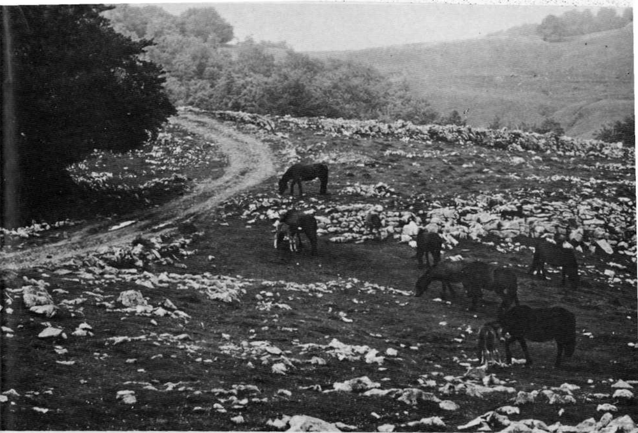
Pagomari inguturik Igaratzaraino ebakia den bidea, Igaratza inguruan.

Ongi dago aurrerapena, baina hitz honen izenean egiten diren astakeriak, eta zoritxarrez, egingo direnak, etorkizun goibela eta iluna dakar. Dakigunez, azken batzarrean Euskal Mendiko Elkargoak honetaz mintzo zela; Arañzadi elkarteak Izadiaren osotasunaren alde egiten ari den lan joria. Denon lana beharrezkoa dugu —eta baldin ez da aski izango—. Nahiz erakundeek erabakiak zuzendu, mendizale eta elkargo guztien kezka, burutapenak eta lanak beharrezkoak ditugu erazo honetzaz jabetzearren, gutxienik, iritzi eta ekintza jator batetara irixteko. Zeren, plangintza orokor eta zabal bat ametsa litzake, ez baitugu, oraingoz, egoera konkretoan, euskal egiturarik, gizarte maila guztiak babes eta antola ahal daitekeenik.