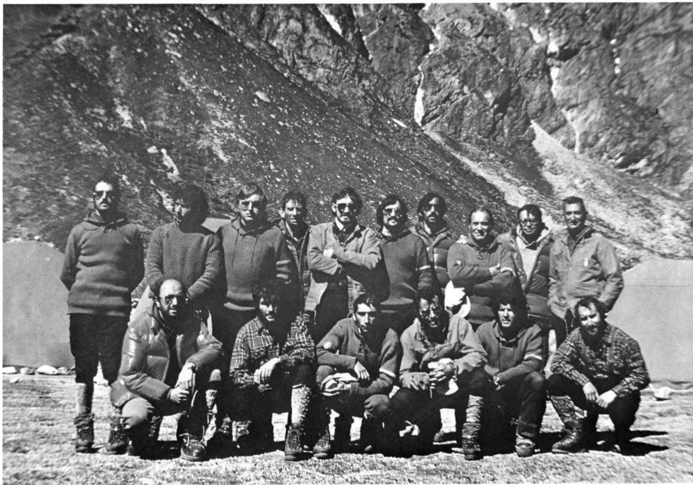
Foto de los 16 Expedicionarios