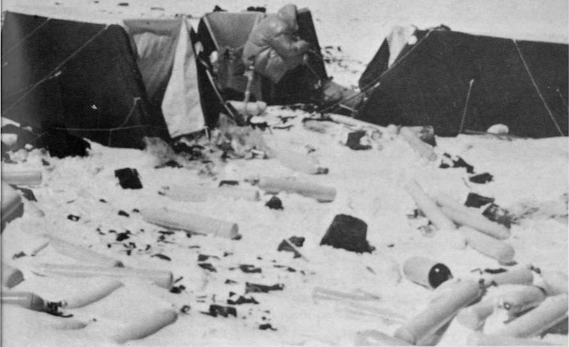
Campo V, o Collado Sur. Se observan botellas de oxígeno de otras expediciones.