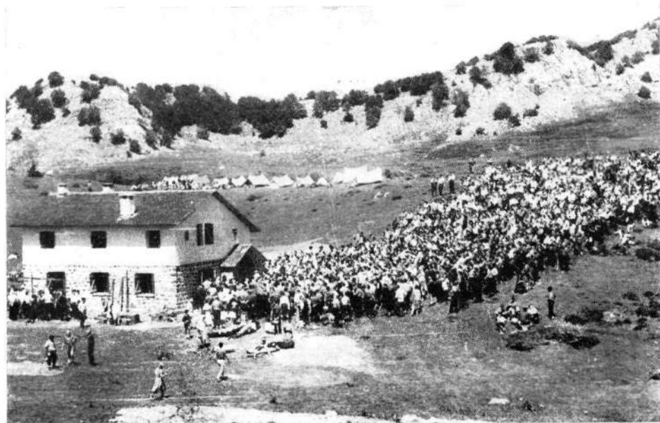
Inauguración del Refugio "Angel de Sapeña" (Gorbea) (1960)

Tenemos materia para desarrollar los propósitos de organización de cara al futuro, como empresa de todos.