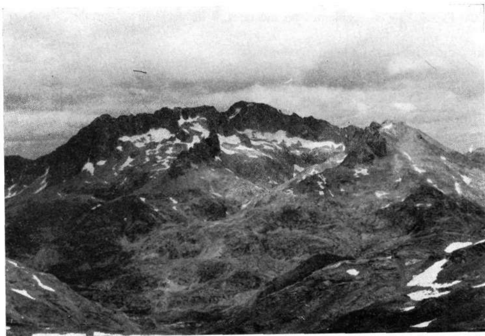
Macizo de Balaitus. Futuro emplazamiento de un Refugio de la F. V. N. M.

16 de junio: IV Marcha de Orientación Regional, organizada por el G. M. Edesa, de Basauri (Vizcaya), en colaboración con la F.V.N.M.