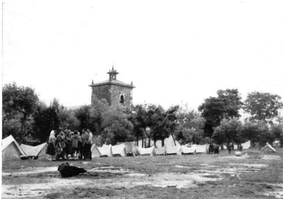
Congreso y Campamento en Arrate, Junio 1959

Se celebró en Bilbao, Pamplona y San Sebastián.