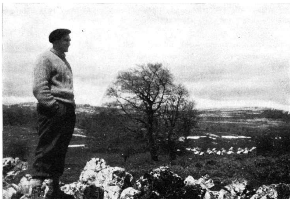
I Campamento Regional en Legaire, Mayo 1959

participantes. S. M. Bordatxo, de Usúrbil: 138 participantes. M. Ordizianos, de Villafranca de Ordizia: 6 clubs, 42 participantes. S. M. Morkaiko, de Elgóibar: 9 clubs, 120 participantes. Total: 594 participantes (1.061 en 1972).