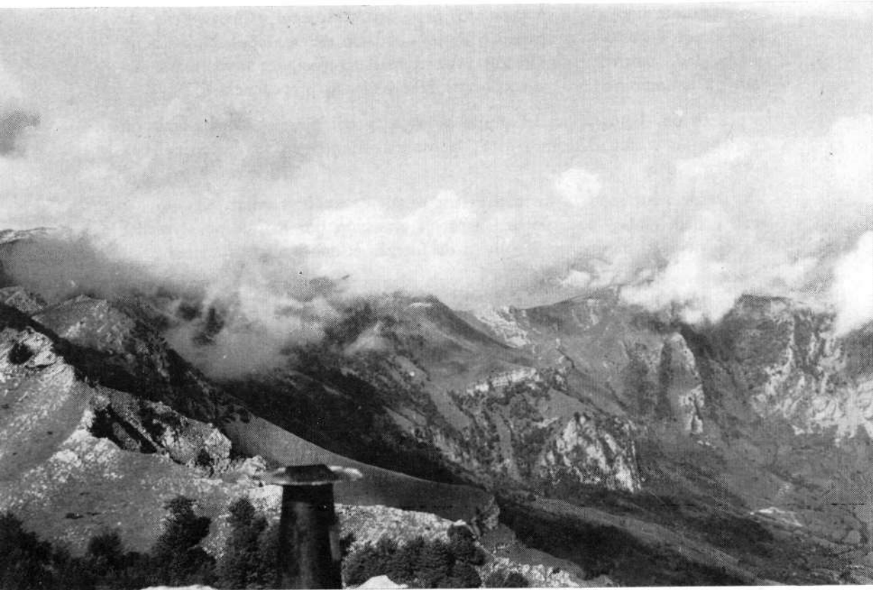
A primera hora había niebla en las cumbres.

Las nubes se han disipado. Los picos situados en Guipúzcoa, sobre el barranco de Aritzaga: Pardarri, Ganbo, Ganbo-txiki, Uzkuiti y en otro pla-