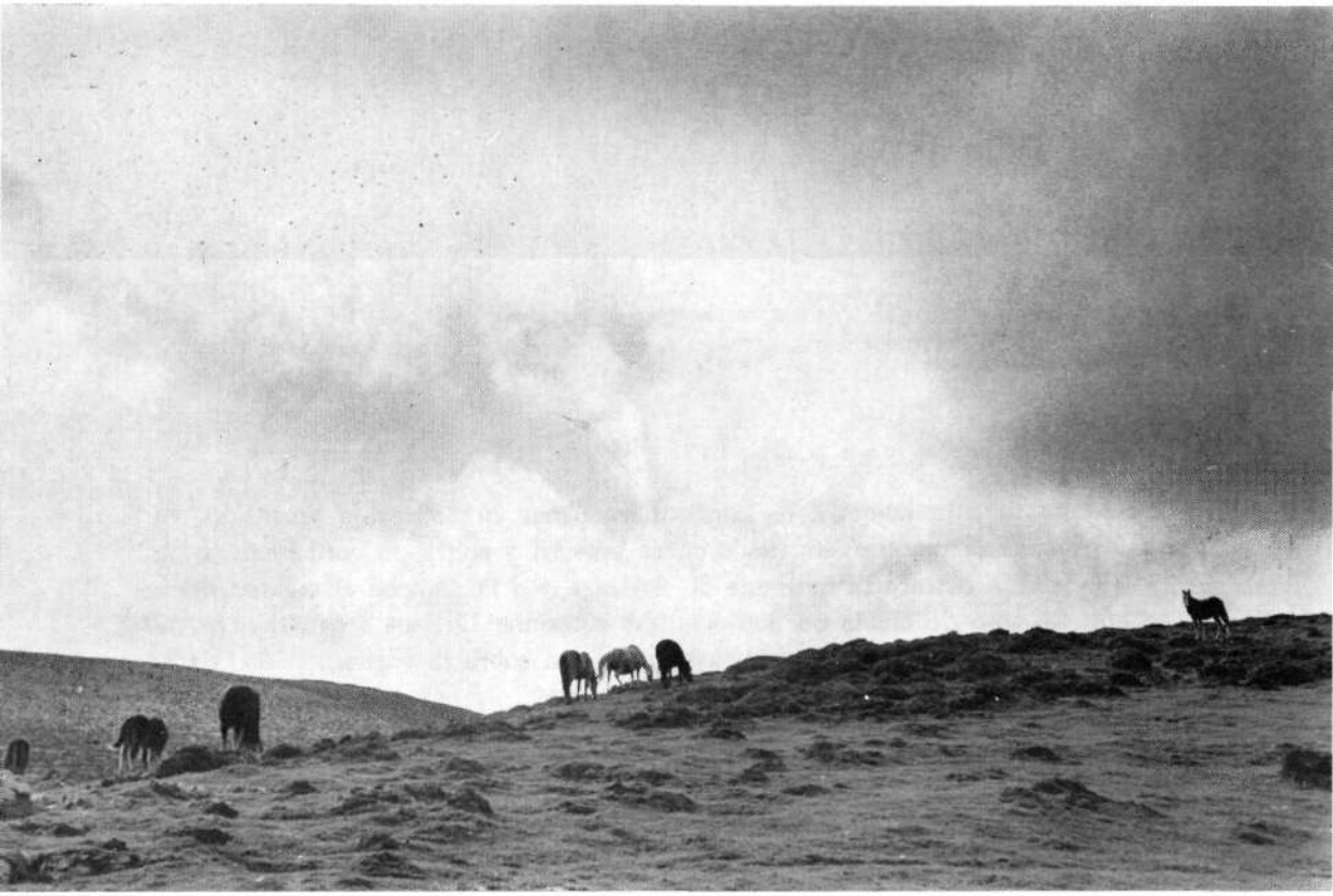
Donde pastan un grupo de caballos y cuyas siluetas destacan en un alto.

no Txindoki altivo centinela, parecen reposar tal es el silencio y tranquilidad que rodea el ambiente.