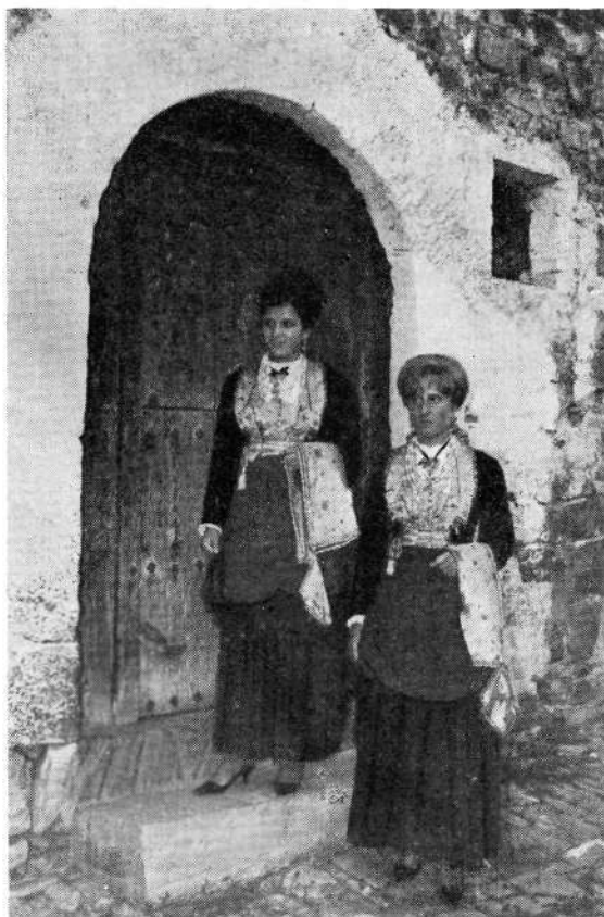
Jóvenes roncalesas ataviadas con trojes típicos del valle.

Pero, donde mejor y más completas aparecen es en Kantikak (Abbaye N.—D. de Belloc. Urt, 1948), atribuidas como canciones populares suletinas de Navidad, pág. 288, canción 237; pág. 296, canción 243. En dicha obra, al igual que en las de Azkue y P. Donostia, encontraremos la música.