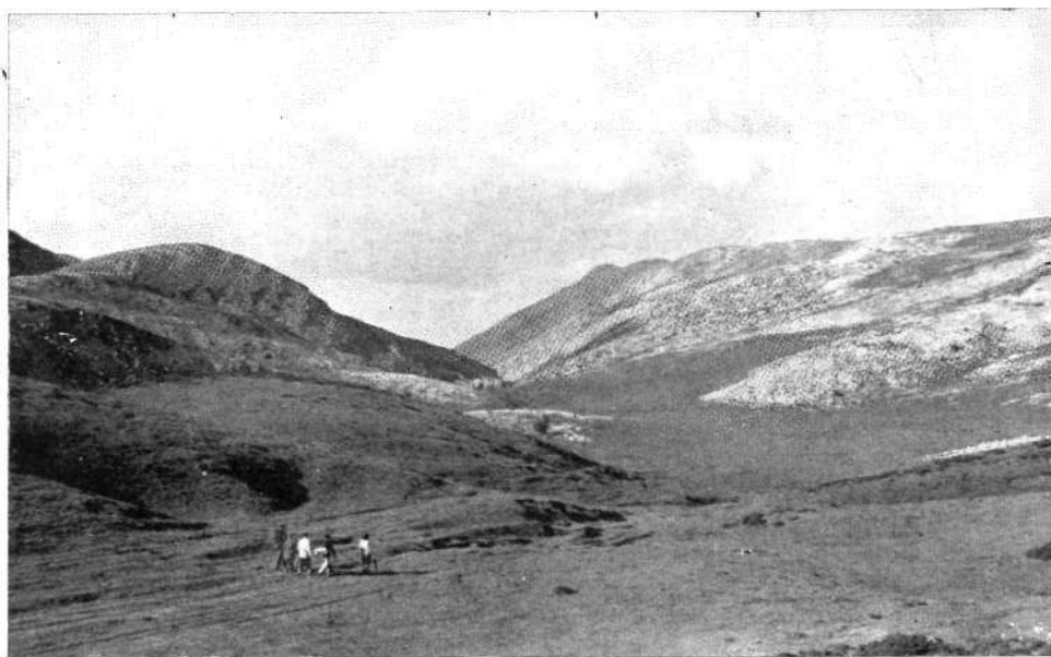
Planicies de Igaratza. De izquierda a derecha, Ontzanburu, Labeon'go punte e Igaratza (Peri-leku).