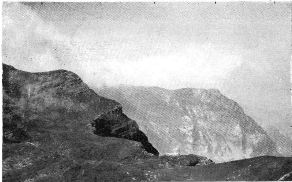
Desde Intze-ko Torrea (Irumugarrieta). De izquierda a derecha, Aldaon, Mallo-zarra y Urreako-aitze.