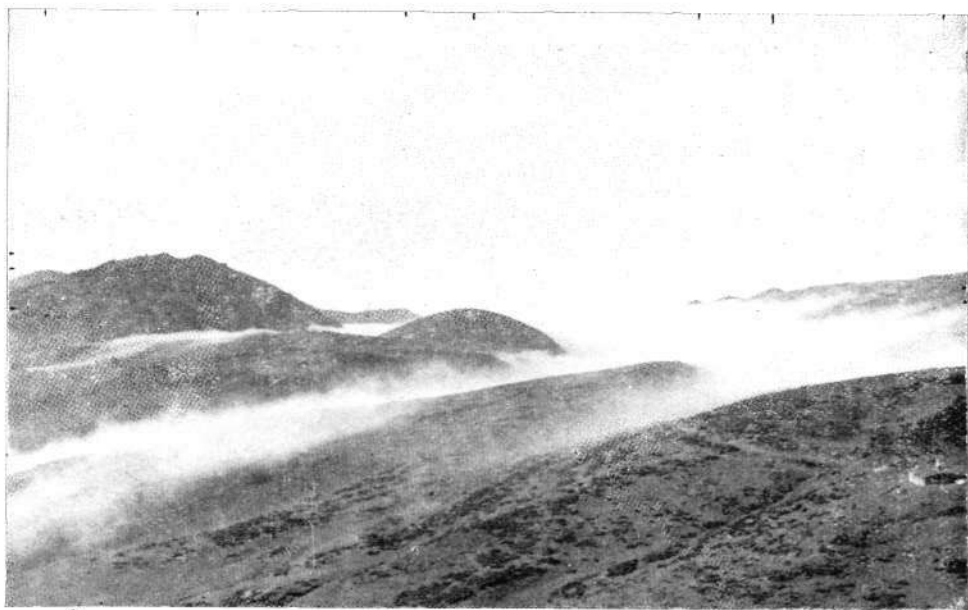
Nieblas vespertinas desde Arañe-ko langa. De izquierda a derecha, Ganbo, Pardarri, Salin-gain, Ontzanburu, Labeongo punte, Etzaal y Refugio de Igaratza.