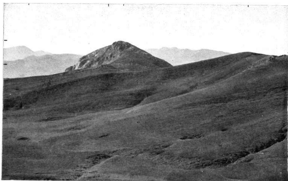
Desde el pico Uarrain. De izquierda a derecha, Auntzizegi, Txindoki y Arrubi.