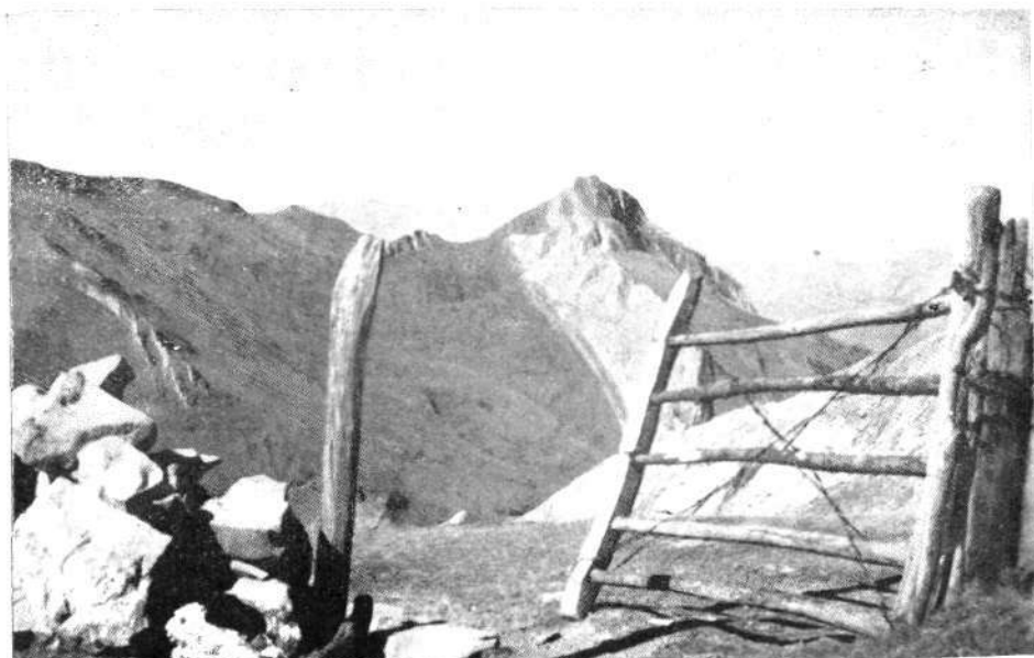
Cumbres de Aralar.