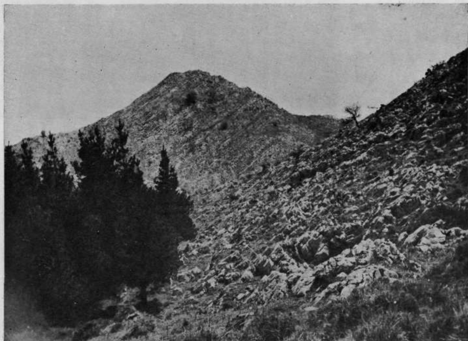
El inconfundible perfil de la peña de Gainzorrotz del macizo de Aramotz.