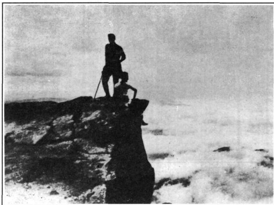
Mar de nubes desde Castro-Valnera