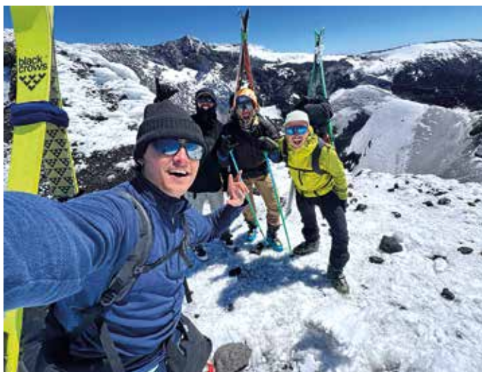
Ruca Pillan sumendiaren krater ertzean laurok

dira. Benetan ederra eta emankorra izan da gaurkoa, eta mokadua partekatuz eman diogu amaiera egunari.