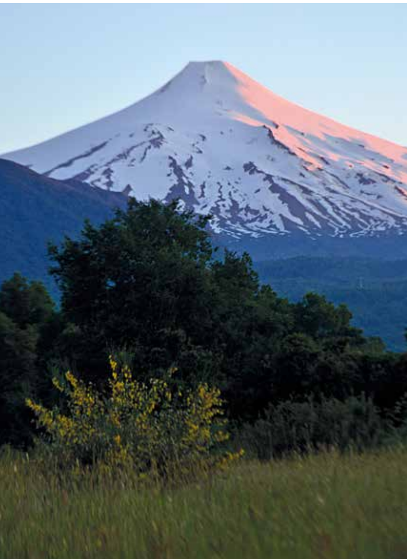
Ruca Pillan sumendia