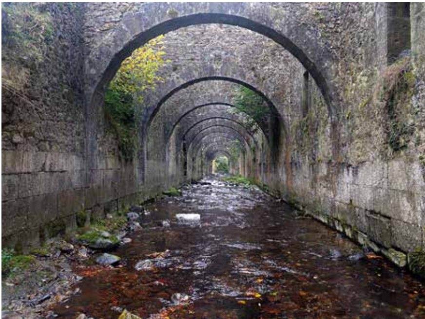
Fábrica de Armas y Municiones de Orbaizeta

A nuestra derecha, las hayas desprovistas de hojas parecen trepar por las laderas del valle de Txangoa.