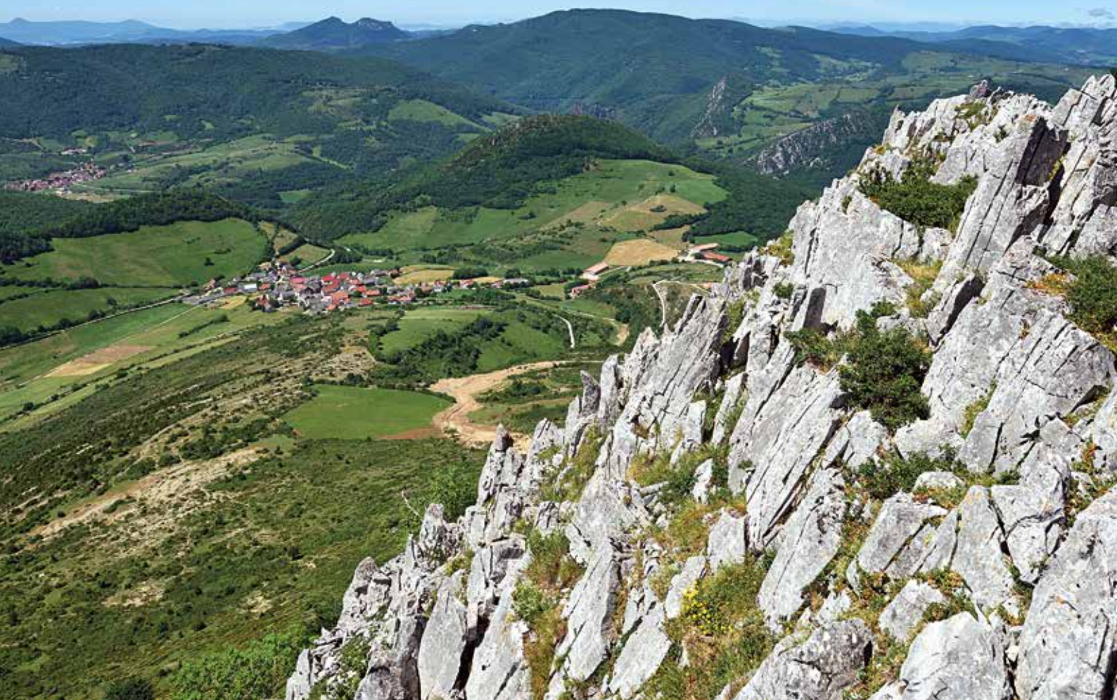
Hiriberri Aezkoa bajo los cortados de Berrendi

S, hacia Ugaibel, que también bordeamos sin hacer cima. Unos centenares de metros más allá, nos adentramos en el hayedo que cubre la ladera N de Berrendi y lo atravesamos hasta los cortados que lo delimitan cual muro infranqueable. Así alcanzamos la cima (1351 m) y el observatorio desde el que divisamos el valle de Aezkoa y los pastos y robledales que rodean Hiriberri Aezkoa. Por allí cerca, al pie del monte Petxuberro, queda la reserva natural de Tristuibartea, una arboleda de roble peloso acompañada por un rico sotobosque de boj.