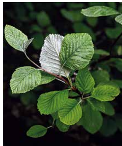
Hojas de mostajo

Orbaizeta nos vemos obligados a cruzar el río Irati por un vado de hormigón para vehículos. Nos remangamos los pantalones y sin descalzarnos atravesamos el arroyo para refrescarnos los pies. El calzado se secará en el tramo que resta hasta Orbaizeta.