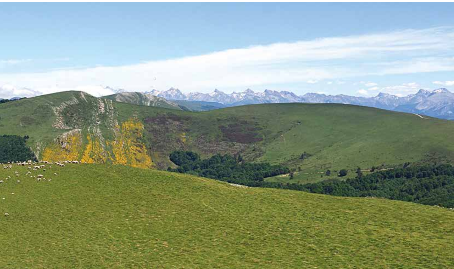
Orhi, Abodi y el pirineo de Belagua