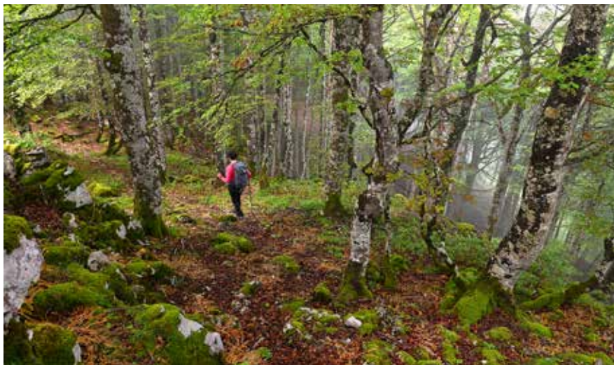
Hayedo de Mendilatz