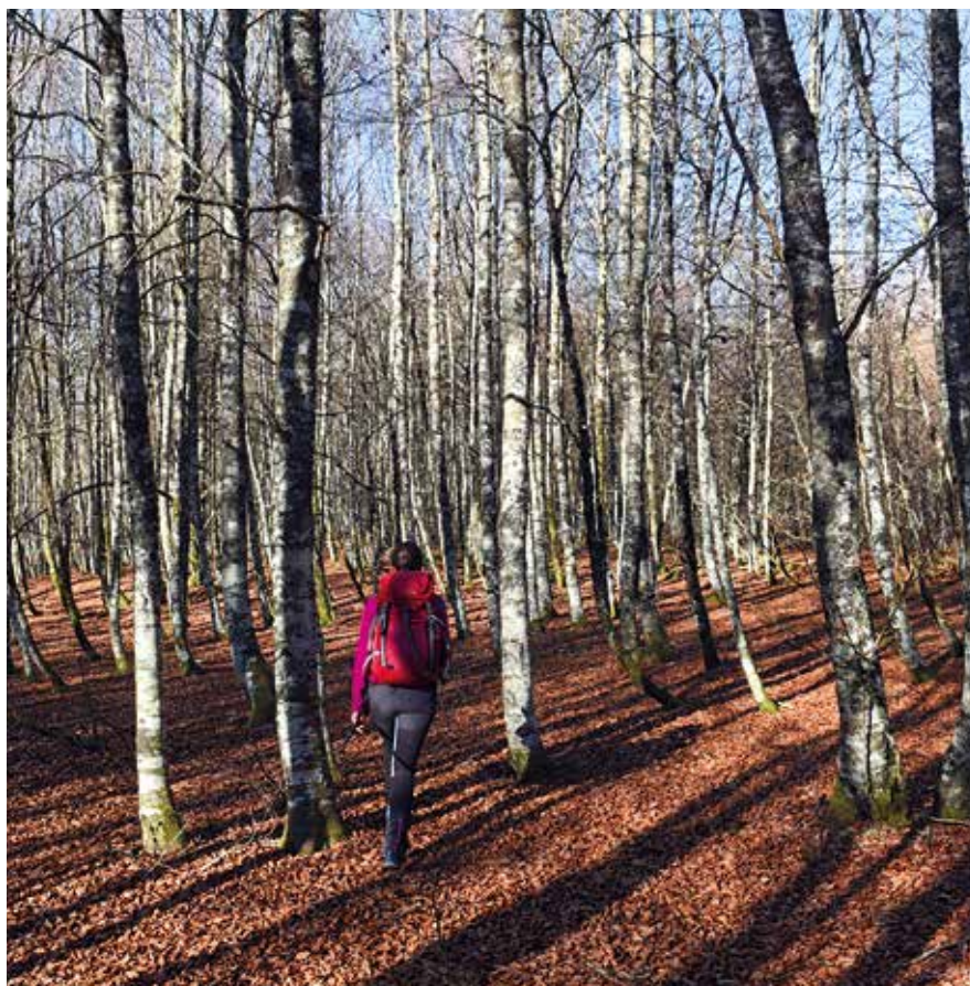
Hayedos de Ortanzurieta

Los hábitats naturales más interesantes se localizan en las zonas más altas y se en-