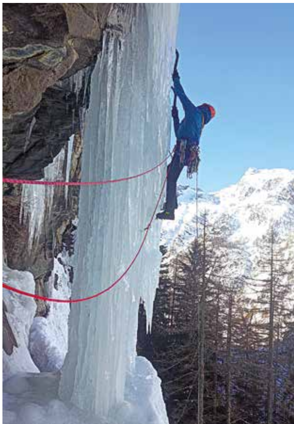
Wild grisenche bidea (M9, Cogne Aosta, Italia)

Azken bide hori askoz errazago egin genuen, traba handirik gabe; iluntzean bertan Italia aldera jo genuen, hurrengo eguerdian hegazkina hartu behar baikenuen. Egia esan, bi txango zoragarri izan genituen: toki paregabeetan eskalatu, proposaturiko erronkak bete eta gure lagunartea estutzeko aukera izan genuen.