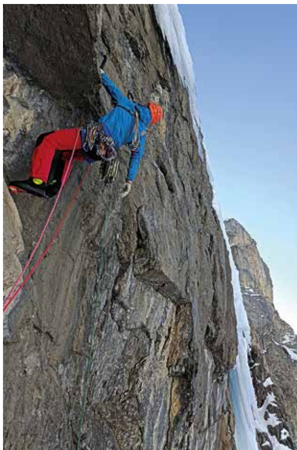
Elementaireilchen bidean (M8 Kandersteg, Suiza)

Laugarren egunean, beste bailara batetara joan ginen, Bolzanotik ekialdera, Val de Gares deituriko bailarara. “Valbone Ice Fall M11+” igotzea zen asmoa; klasiko bat, zailtasun horretan munduko lehena. Nik atsedean nahian jarraitzen nuen eta egun hartan aseguratzeko asmoa baka-