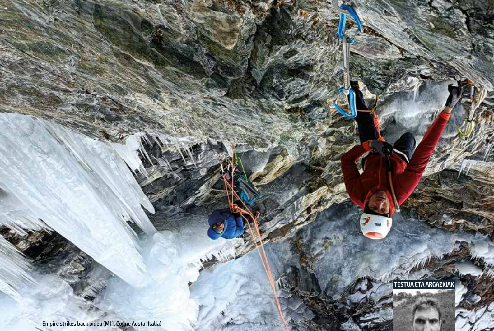
Empire strikes back bidea (M11, Cogne Aosta, Italia)