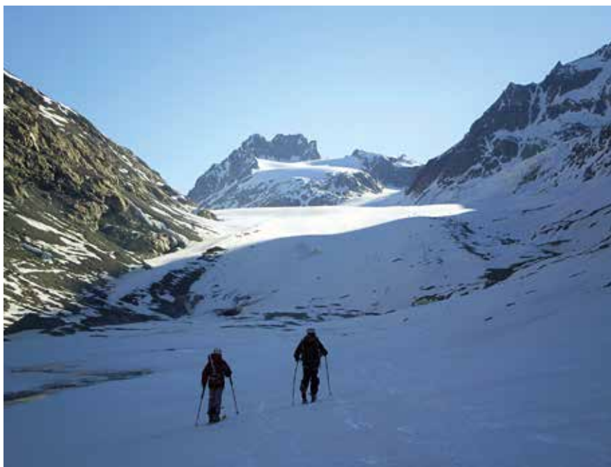
Otemma glaziarra iristen

Jaitsiera labur batek Tsa de Tsan glaziarra garamatza. Interneten kontsultatuta, glaziarren izen berezi horrek "glaziarren aurreko azken larrea" esan nahi omen du, hizkuntza frankoproventzalean. Foka-larruak glaziarreko ordekan jarri ditugu azken aldiz. Gaurko hirugarren lepora igotzen hasi gara, 450 metro inguruko desnibelera dagoena. Eguzkia jaun eta jabe, eguraldiaz eta aldapa leunen igoeraz gozatzen gabiltza. Bai horixe! Hamaika eta erdiak pasatxo zirenean Valpellineko lepora (3557 m) iristean, zeharkaldi honen edertasunaren gaina eta bikaina dakusa-