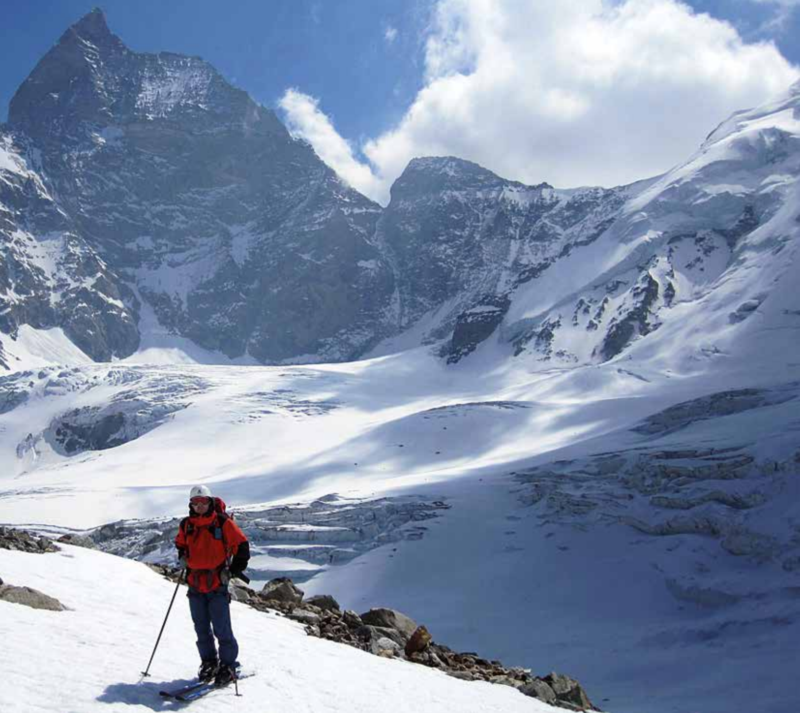
Matterhorn edo Cervinoren azpian

nire artean kezka apur bat sortu dit: "Hau hasiera besterik izanik, nola demontre mol-datuko gara gainerako glaziarretan?".