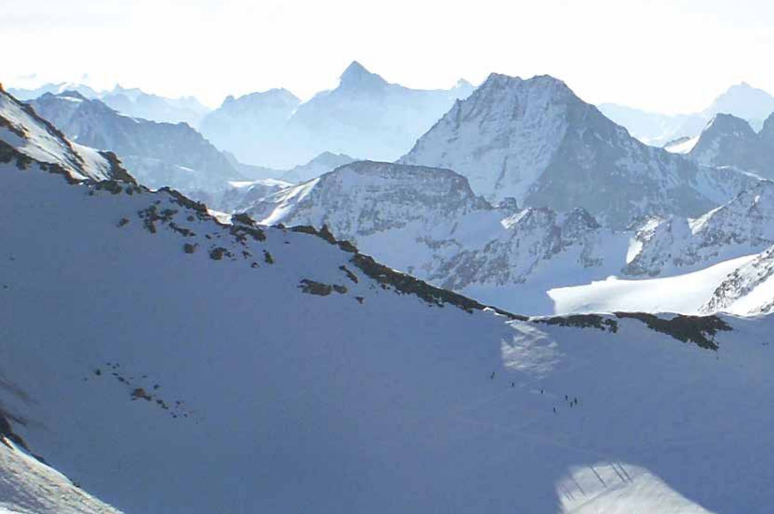
Plateau de Couloir lepotik ekialderantz, lehenengo planoan Sonadongo lepoa eta atzean La Singlaren gandor zerratuaren ingerada

doko elurbizia abiatu da Tseudet glaziarrean behera, sekulako bisuts-hodei bat sortuz. Minutu pare bateko ikuskizun ahaztezina.