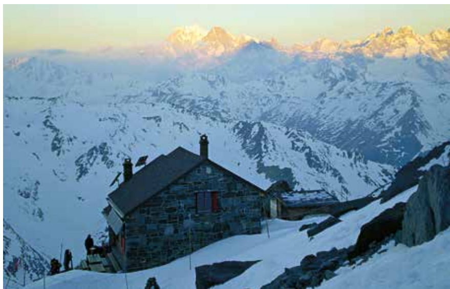
Egusentia Valsoreyko aterpetik, urrunean Mont Blanc eta Grandes Jorasses

Atzoko etapa samurraren aldean, gaurkoa gogorra da, motxilatzarrekin 1400 metroko desnibela igo behar baitugu. Ahalik eta