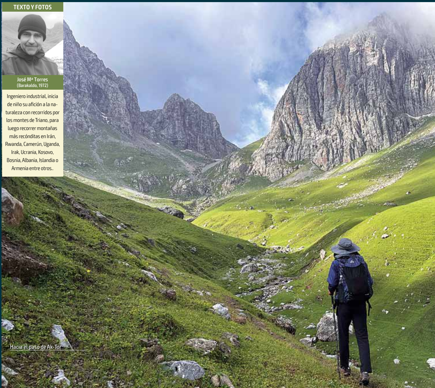
Hacia el paso de Ak-Tor

Ingeniero industrial, inicia de niño su afición a la naturaleza con recorridos por los montes de Triano, para luego recorrer montañas más recónditas en Irán, Rwanda, Camerún, Uganda, Irak, Ucrania, Kosovo, Bosnia, Albania, Islandia o Armenia entre otros..