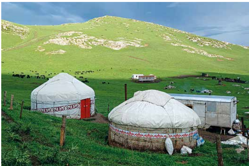
Yurtas en Tepshi Camp

Un tren de pasajeros de la época soviética nos traslada a la ciudad uzbeka de Andijan tras algo más de 6 h de viaje desde la capital Tashkent. En la estación, y bajo un sol de justicia, decenas de taxistas se agolpan para ofrecernos transporte hasta la frontera con Kirguistán, la cual alcanzaremos en menos de una hora de trayecto. Las inmediaciones de la aduana bullen de actividad, donde camioneros hacen turno mostrando numerosos documentos para entrar en el país vecino, y un enjambre de trabajadoras hacen cola portando pesados fardos esperando lo propio para cruzar al otro lado de la frontera. Un pequeño mercado callejero ofrece sus productos junto al primero de los controles de salida del país, don-