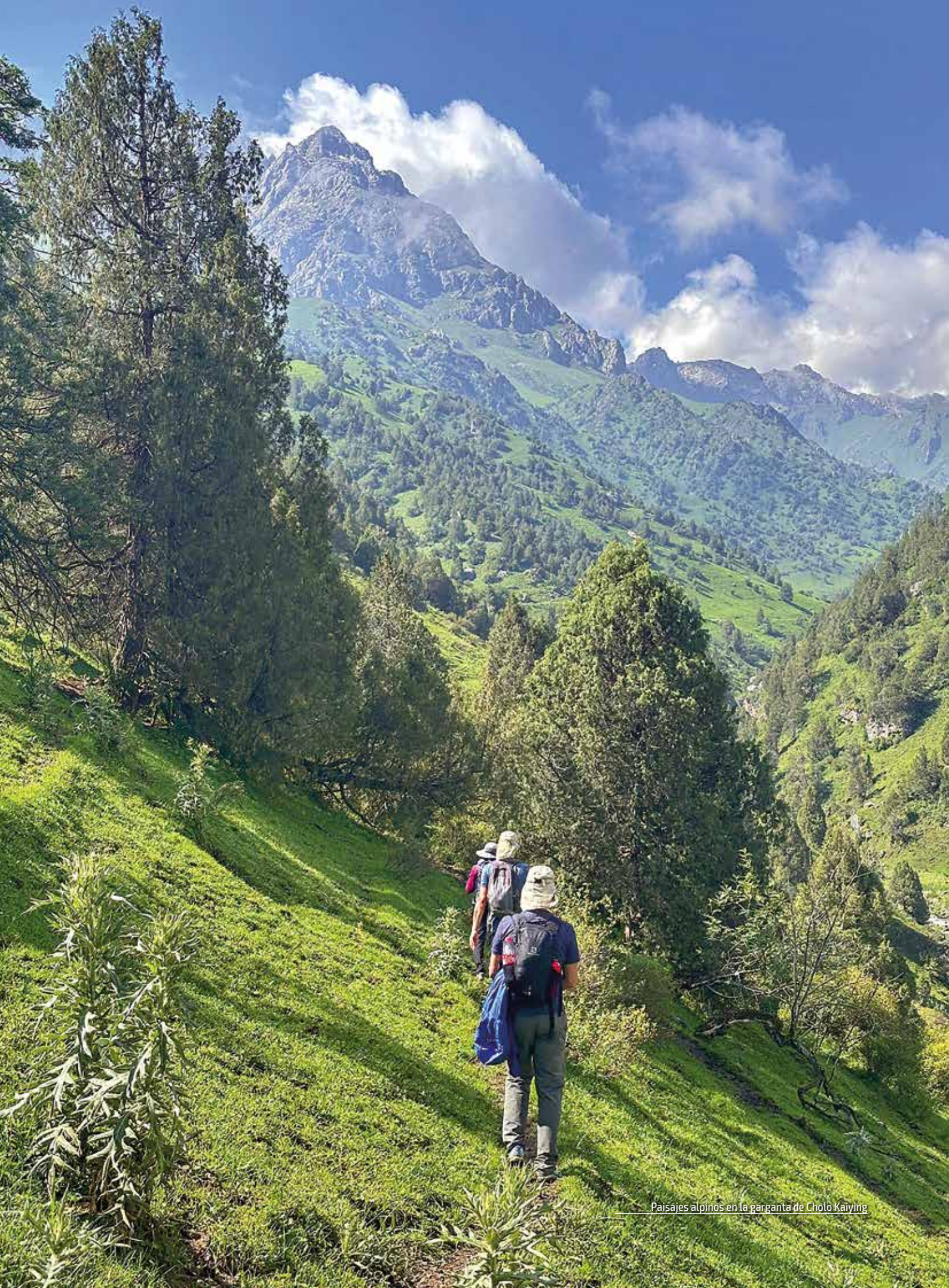
Paisajes alpinos en la garganta de Cholo Kaiying