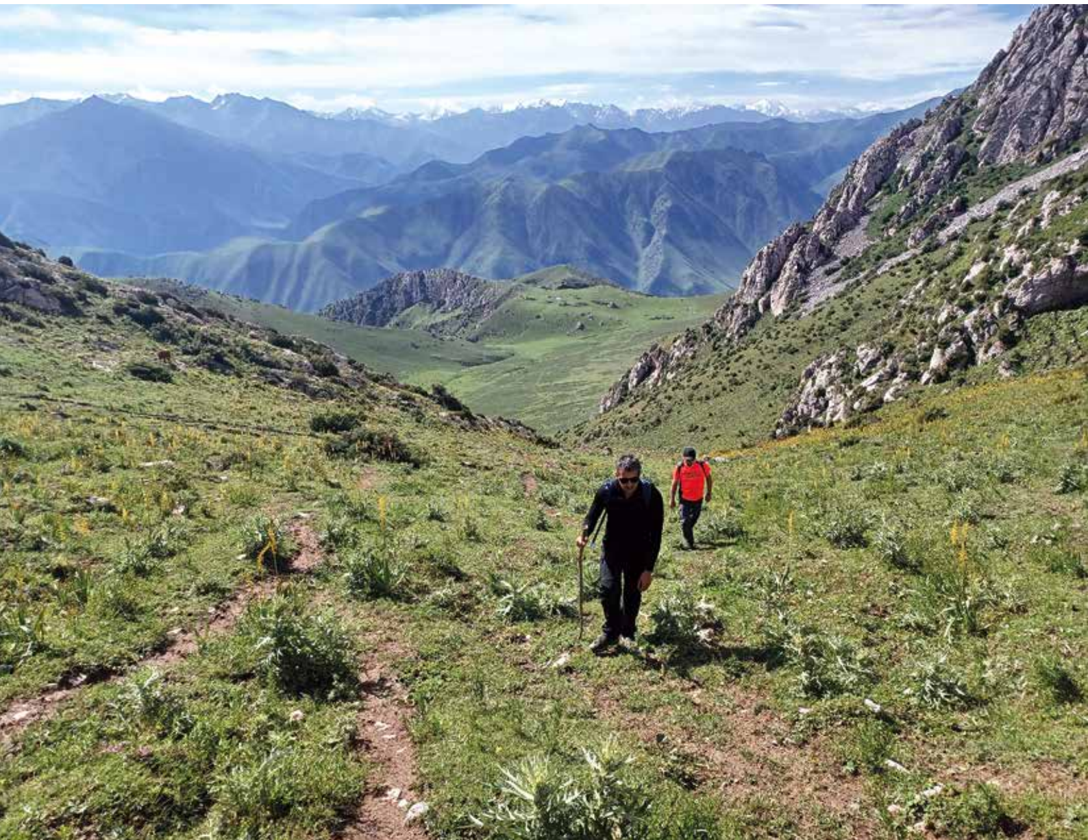
Ascendiendo hacia el paso de Airy Bel

sobre el campamento haciendo descender mucho la temperatura. Anochece cuando cesa la lluvia, y mayores y niños hacen un esfuerzo colectivo para agrupar las ovejas dispersas y reunir las en los cercados. A pesar de haber encendido la chimenea de fundición que hay dentro de la yurta, el frío a esta altitud nos obliga a acurrucarnos bajo la manta y, mientras el sueño nos va venciendo, escuchamos el silencio de la noche sintiéndonos afortunados de encontrarnos en este remoto rincón del planeta.