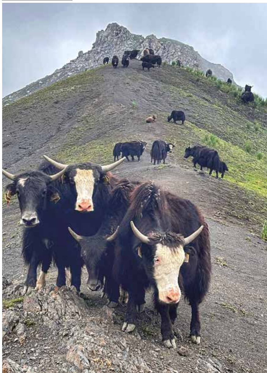
Yaks en el paso de Ak-Tor

La mañana de nuestro tercer día de trekking amanece radiante. El intenso azul del cielo, los verdes prados y el aire puro de la alta montaña activan nuestros sentidos mientras Bekzat ya nos espera con el caballo ensillado. Nos despedimos de la numero-