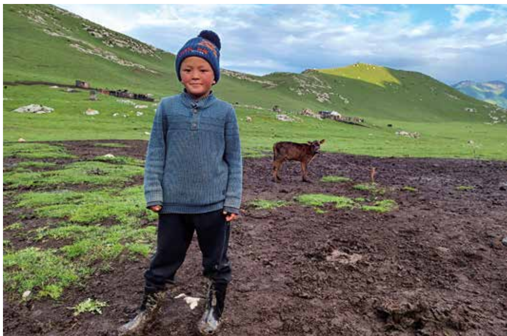
Pequeño pastor de Tepshi Camp

Tras cruzar de nuevo el arroyo, caminamos junto a su orilla hasta encontrar un desplome que debemos salvar con una fácil trepada para seguir avanzando río arriba. Después de una breve parada de avituallamiento, Ernís nos indica que debemos volver a cruzar las aguas, pero al no localizar un punto donde vadearlas, nos vemos obligados a superar el cauce a caballo tras abandonar un infructuoso