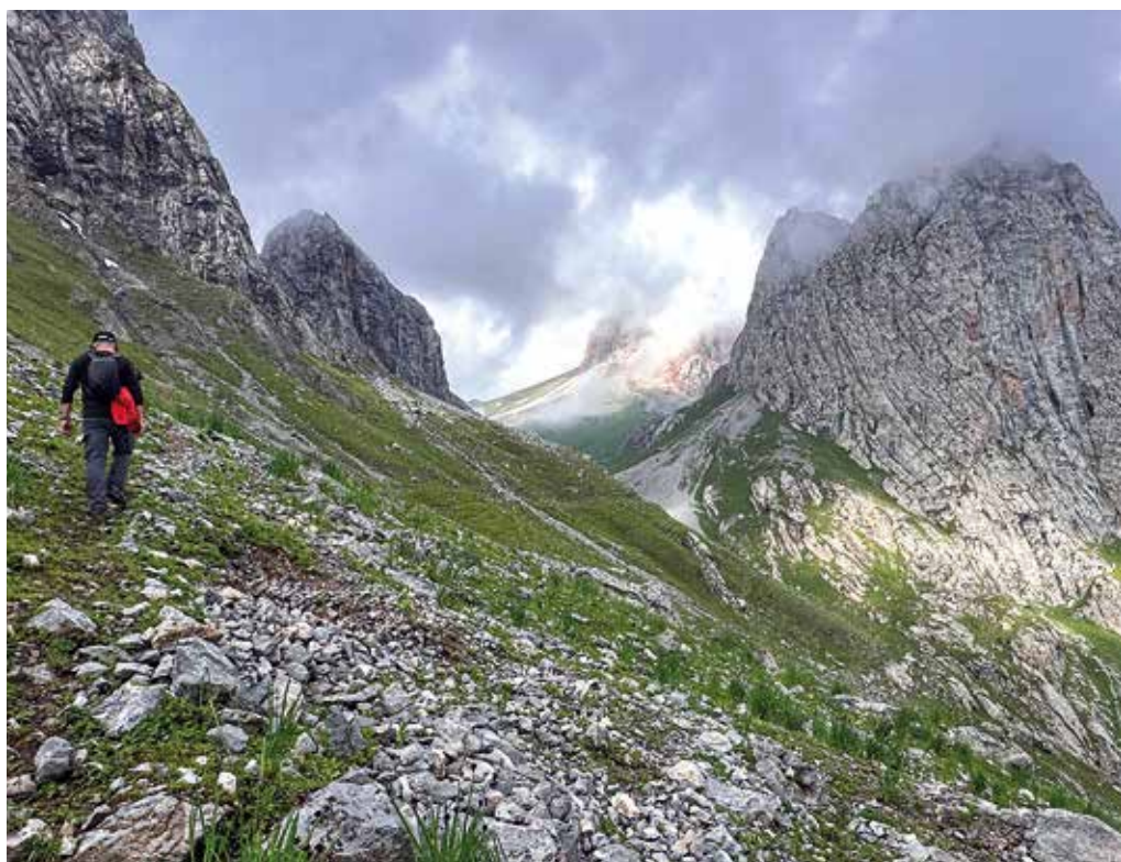
Inmediaciones del paso de Asan Rabat