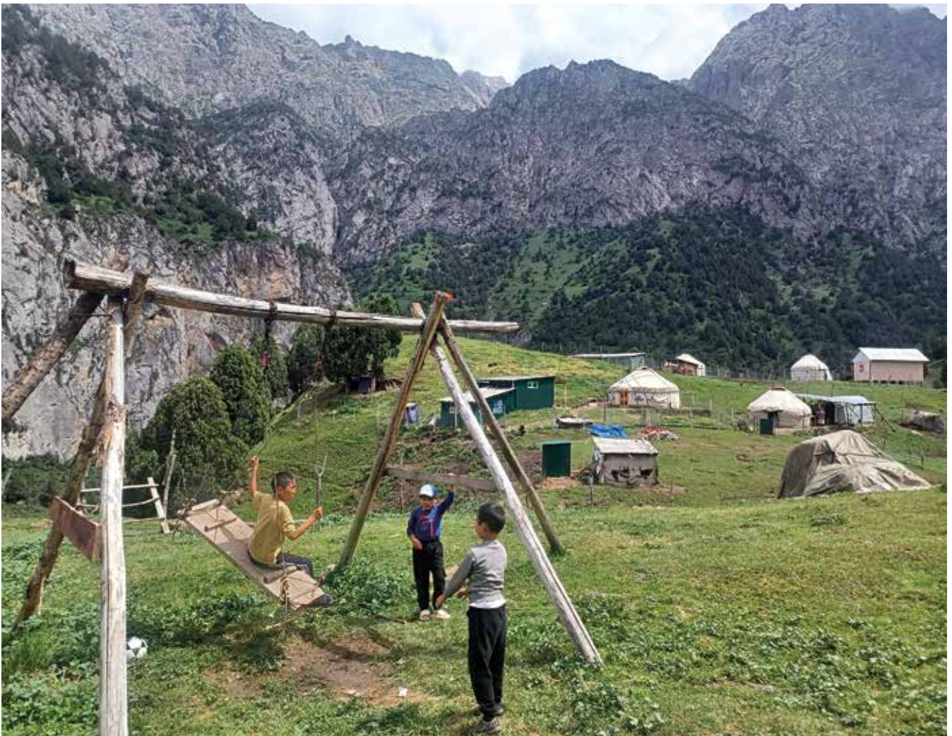
Campamento de yurtas de Sary Oi

Nos acomodamos en la yurta, donde nos ofrecen té, mantequilla, rodajas de tomate, pollo y mermelada para reponer fuerzas. La tarde se ha complicado y una fuerte tormenta descarga un aguacero