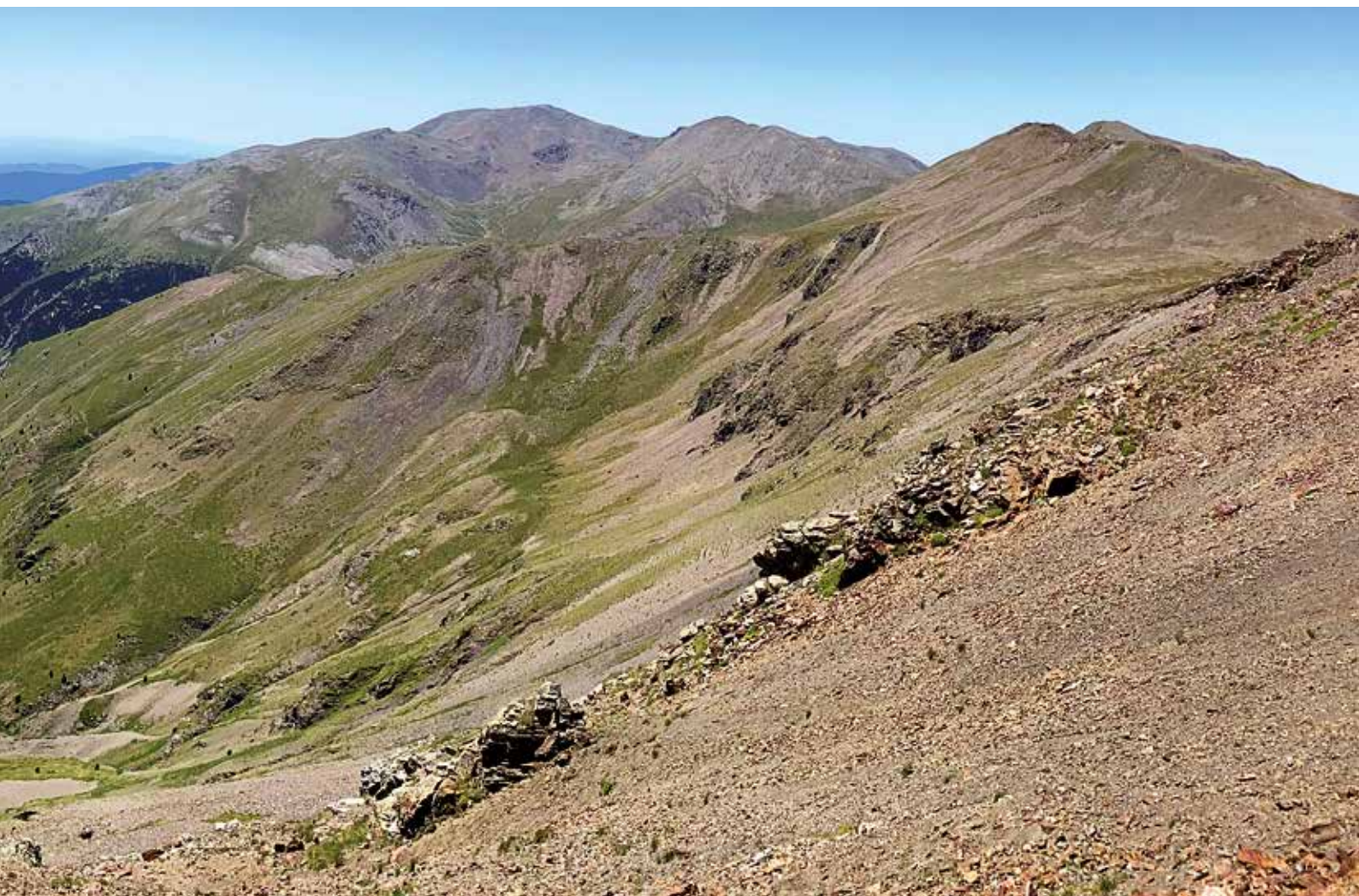
Valle de Núria

de les Arques (2782 m), Rocs Blancs (2783 m) y Puig de Fontnegra (2727 m). Para realizar este último tenemos que desviarnos. Tiene unas vistas preciosas del Cim de la Coma del Clot y Torreneules.