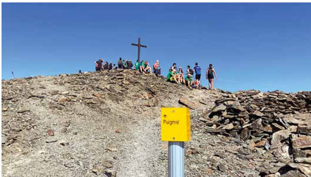
Cima del Puigmal

Ya en el tramo inicial podemos divisar varios rebecos corriendo por las laderas. La fauna y la flora del lugar son otro de los grandes atractivos, con la posibilidad de avistar especies como el rebeco o el águila real, y de contemplar una variada