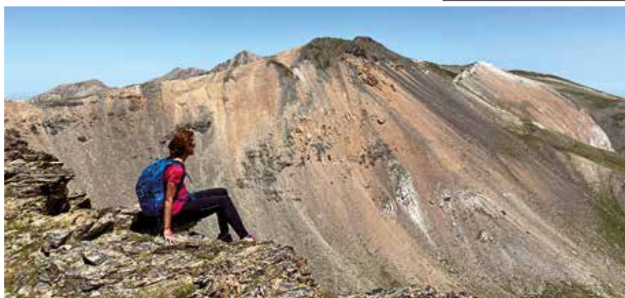
Vistas desde el cresterío

Una vez finalizada la ruta, sentimos la satisfacción de haber cumplido un reto que teníamos en mente desde hace tiempo y que nos ha permitido disfrutar de una zona del Pirineo que desconocíamos y que consideramos imprescindible para aquellos que desean conectar con la naturaleza. Combina esfuerzo, belleza y una profunda conexión con el entorno natural.