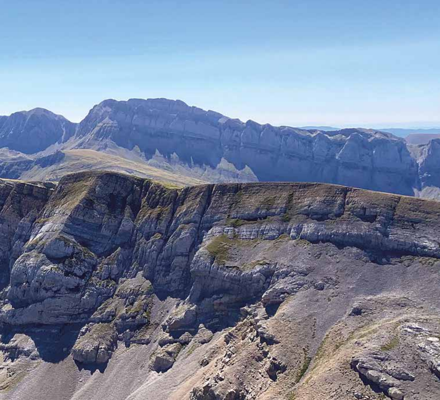
Panorámica desde la cumbre: Quimboa, Petraficha, Chipeta, Peña Forca y Alanos

hacia la derecha. Estamos muy cerca del final. Tras recorrer los últimos 15 m, salimos a la meseta cimera y cubrimos a pie la distancia que nos separa de los 2266 m de nuestro objetivo, el Mallo Gorreta.