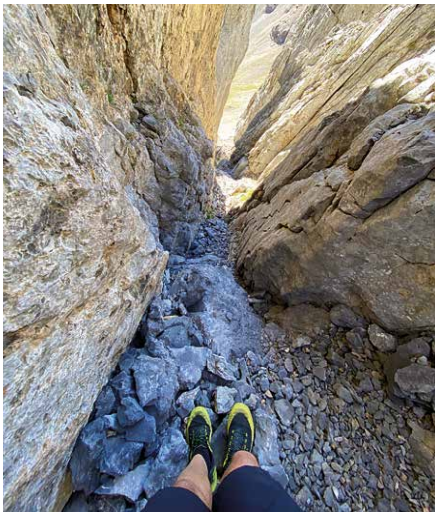
Vista de la canal

Llaneando esta vez, avanzamos en dirección a nuestro objetivo, que se eleva frente a nosotros. Mientras avanzamos, divisamos a su derecha la existencia de una gran depresión que constituye su único punto flaco, el lugar por el que nos disponemos a ascender, y que es conocido con el nombre de brecha de Gamueta. El trazado sigue siendo excelente y cómodo hasta llegar a la cota 1850 donde las balizas verde-amarillas giran a la