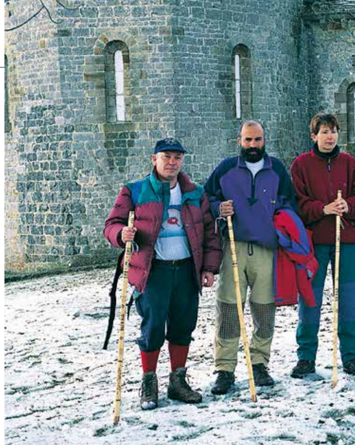
Las cinco makilas parten de San Miguel de Aralar en el 75 aniversario de la EMF

En el transcurso de un siglo nuestra federación ha tenido cuatro nombres. Fundada en 1924 como Federación Vasco Navarra de Alpinismo, en 1962 pasa a denominarse, por exigencia del estamento deportivo franquista, Federación