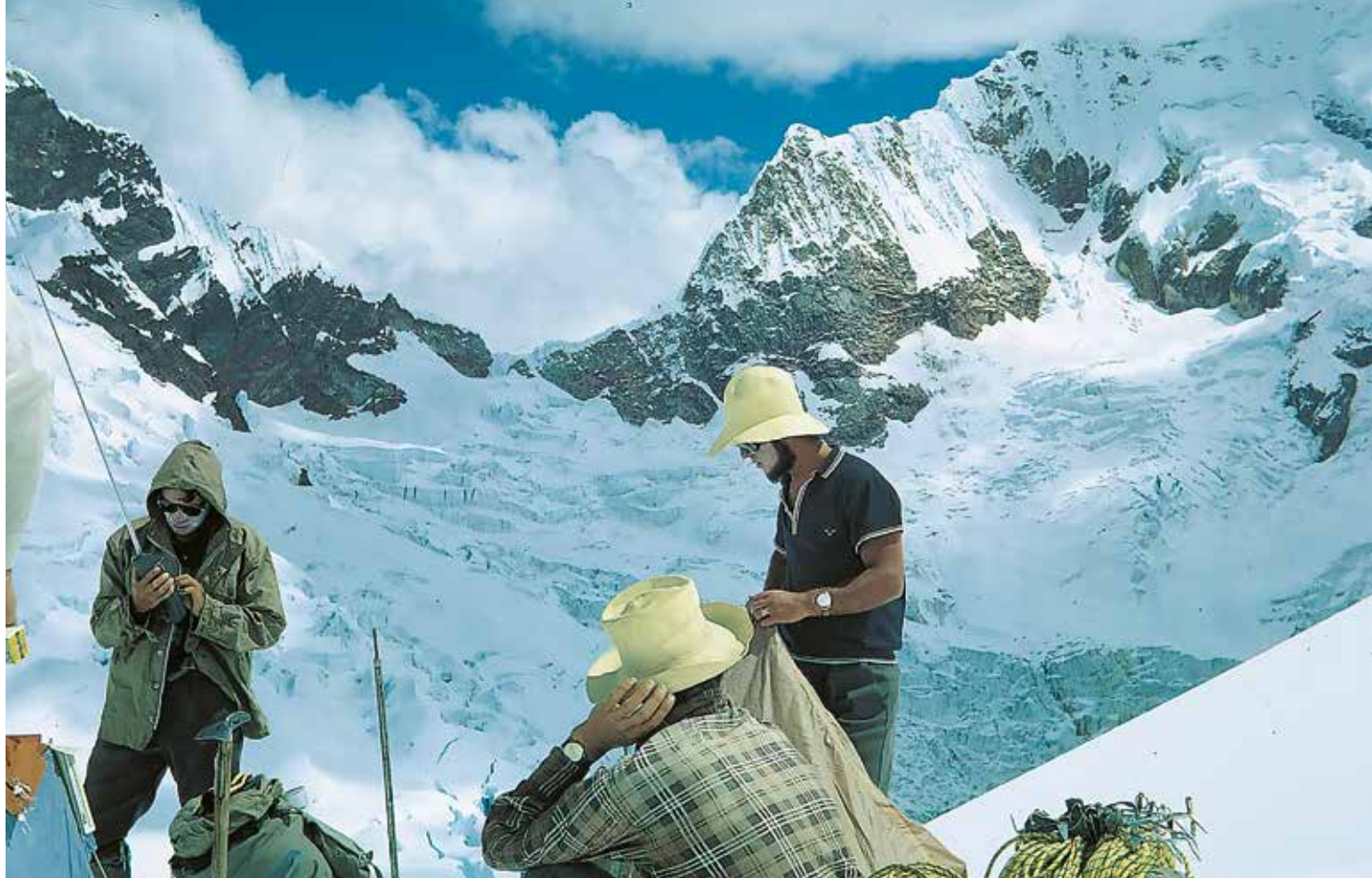
Primera expedición vasca a los Andes de Perú, en 1967

recen en la montaña. En aquellas lejanas fechas se crearon equipos de rescate con gente voluntaria. Al tecnificarse y profesionalizarse, la seguridad en la montaña pasa a depender de las instituciones públicas.