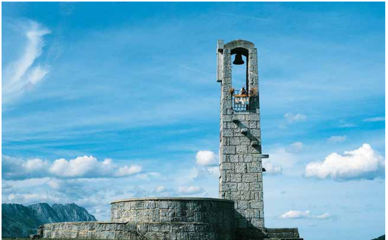
Monumento de Besaide, desde 1955 punto de encuentro de los recuerdos de nuestro montañismo