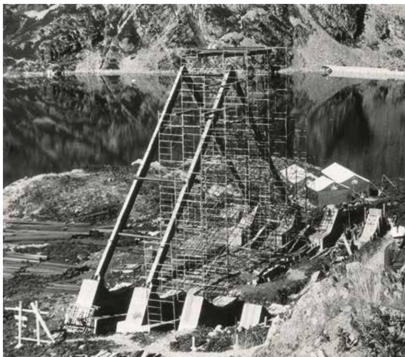
El refugio de Piedrafita en construcción

tas del montañismo vasco. Antxon Bandrés Azkue (1924-1928) fue el primer presidente. Pantxo Labayen (1933-1935) evitó la disolución de la federación en un periodo de crisis. El golpe de estado franquista le tocó a Antonio Tellería (1935-1936), desapareciendo la federación durante la guerra civil. Con Ángel Sopeña (1949-1958) se reanudan