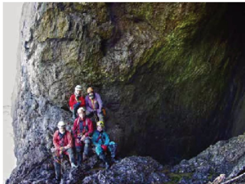
Foto del grupo junto a la boca de Leunbe

Ogoño ha vuelto a ser nuestro gigante acogedor, nos ha permitido llegar hasta Punta Leunbe y nos ha mostrado su Maelström. Nos ha vuelto a llenar de vida. Regresamos a Elantxobe a la luz de los frontales. Por el camino voy pensando que abajo, en Punta Leunbe, seguirán rompiendo las olas contra las rocas, la mar contra la montaña, el Maelström contra la cueva. Lucha de gigantes...