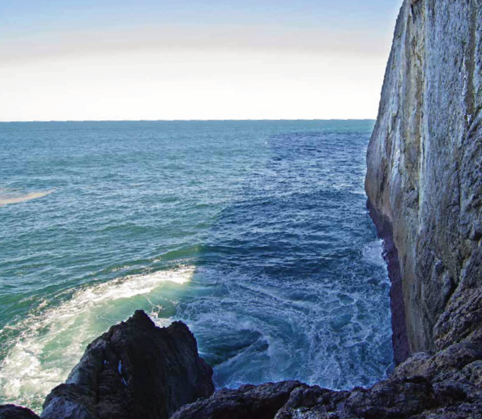
B. Maestró desde la última plataforma de Loube

Rápel tras rápel nos plantamos en una cornisa bastante protegida, una especie de brecha que hace la pared, donde se han asentado algunos árboles. Estamos en el comienzo de la diagonal que cruza en sentido descendente sur-norte toda la cara oeste de la muralla de Ogoño.