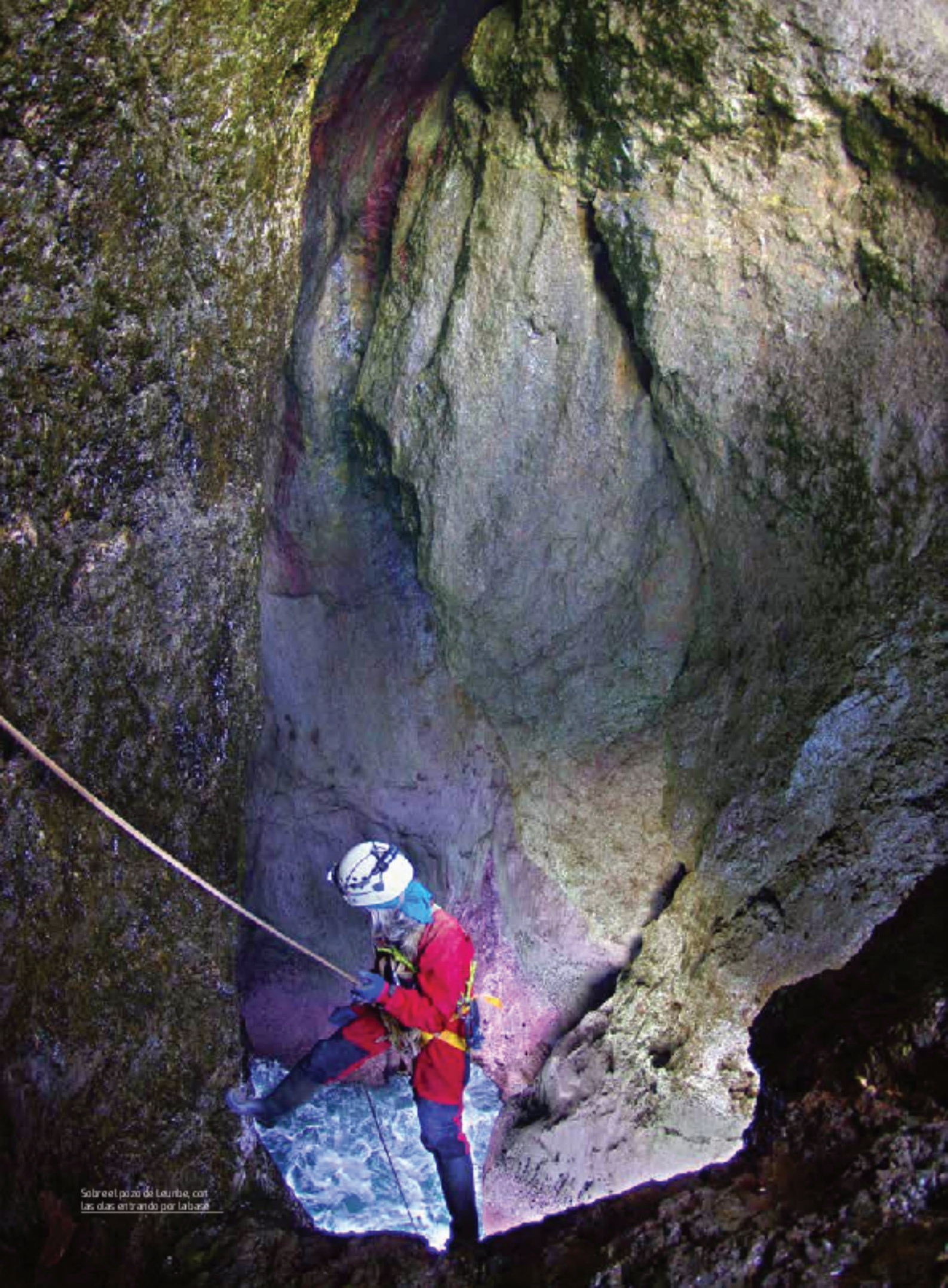
Sobre el pozo de Lourde, con las olas entrando por la base