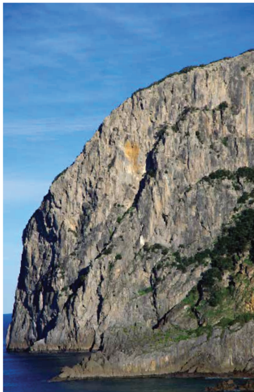
Cara W de Ogoño. La diagonal marca el descenso completo hasta Punta Lourbe

A partir de ese momento todo se precipitó. Un golpe de mar fuerte hizo retumbar la masa de roca y, como si entrá-