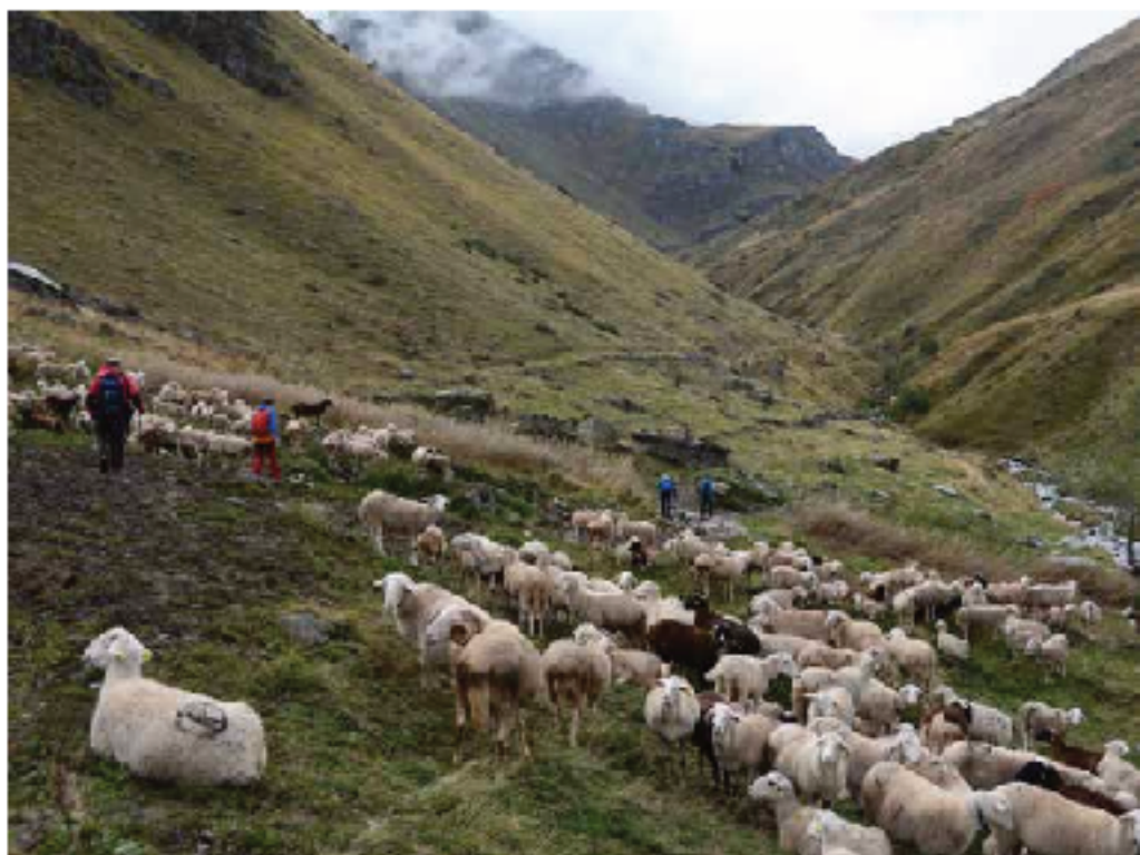
Ovejas pastando al inicio de la ruta al pico Rudoka

Las nubes jugaban con nosotros al escondite y hubo un momento en el que, al perder todas las referencias, nos pusimos nerviosos. Para colmo de males, el GPS empezó a fallar. Al rato y por casualidad, conseguimos encontrar antiguas marcas de pintura que nos guiaron hasta la planicie y los pastos de altura de Fusha Korabit en los que no dejaban de escucharse el balido de las ovejas y los gritos de pastores mandando a sus rebaños.