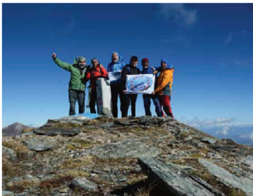
Cumbre y vértice geodésico del Rudoka - e - Madhe (2658 m), techo de Kosovo

Triste historia la de Kosovo cuya independencia, proclamada unilateralmente en febrero de 2008, sólo ha sido reconocida por 97 de los 193 miembros de Nacio-