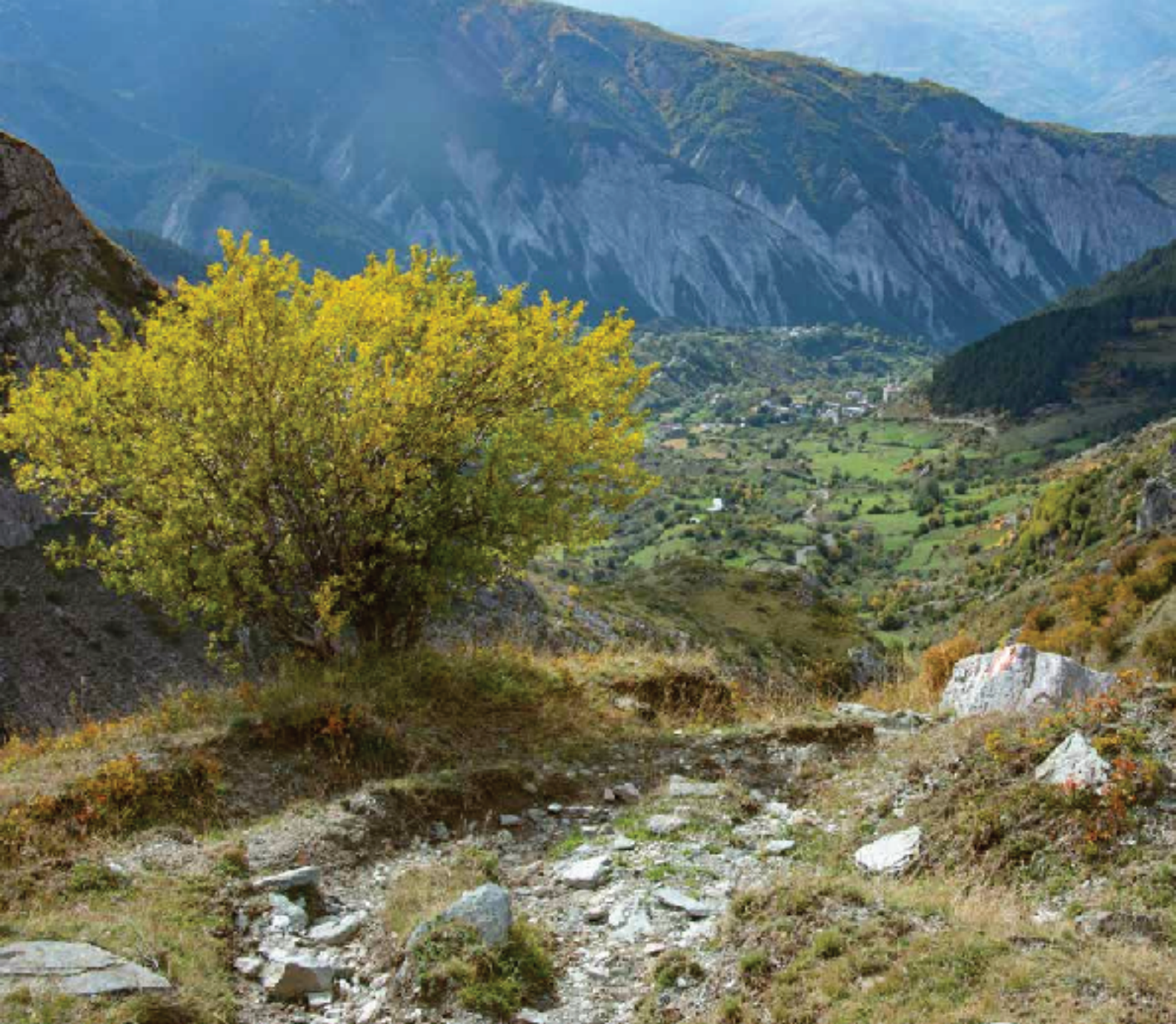
Regresando a Radomirë y al punto de partida

gió un pico puntiagudo que, supuestamente, parecía ser el más alto de la zona. Sin embargo, las marcas del sendero decían lo contrario porque no solamente evitaban la cuerda que se dirigía a él sino que, además, se encaminaban a un collado situado en un lateral (2 h 55 min). Al llegar arriba, comprobamos que todavía quedaba un buen trecho hasta nuestra meta. Como el camino discurría por la dera sin grandes complicaciones, no tardamos en alcanzar la base del último repecho, el que nos llevó al mojón cimero donde, sobre un recuadro pintado de azul, figuraban los dos nombres albaneses de esta montaña: Maja - e - Njeriut y Rudoka - e - Madhe (2658 m, 3 h 30 min).