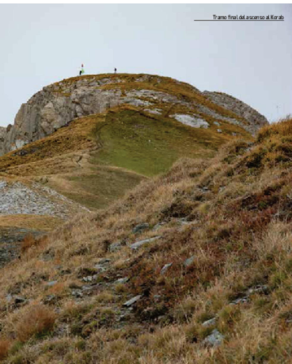
Tramo final del ascenso al Korab

nes Unidas. Tras la ruptura de Yugoslavia, y de forma transitoria, este territorio pasó a formar parte de la República Federal de Yugoslavia. Sin embargo, la disolución del país ocasionó toda suerte de conflictos bélicos entre las nuevas repúblicas y el estado en 1999 de una guerra durante la cual el Ejército de Liberación de Kosovo, apoyado por la OTAN, se enfrentó a las tropas serbias. Los bombardeos sobre Belgrado, la capital Serbia, provocaron, a su vez, el recrudecimiento de los ataques sobre los civiles kosovares y el éxodo de cientos de miles de personas. Existen discrepancias sobre el número de muertos, pero hay quien defiende que se manipularon al alza y que la guerra fue orquestada por EE. UU. para aumentar su control sobre los Balcanes y debilitar a Serbia y a su histórico aliado, Rusia. Tras la derrota serbia, los miles de personas de etnia albanesa que habían huido regresaron mientras que los más de 200.000 serbios que todavía residían en Kosovo, abandonaron sus hogares para refugiarse en Serbia. En la actualidad, todo pende de un hilo y, a pesar de que las negociaciones siguen su curso, ninguno de los dos bandos da su brazo a torcer.