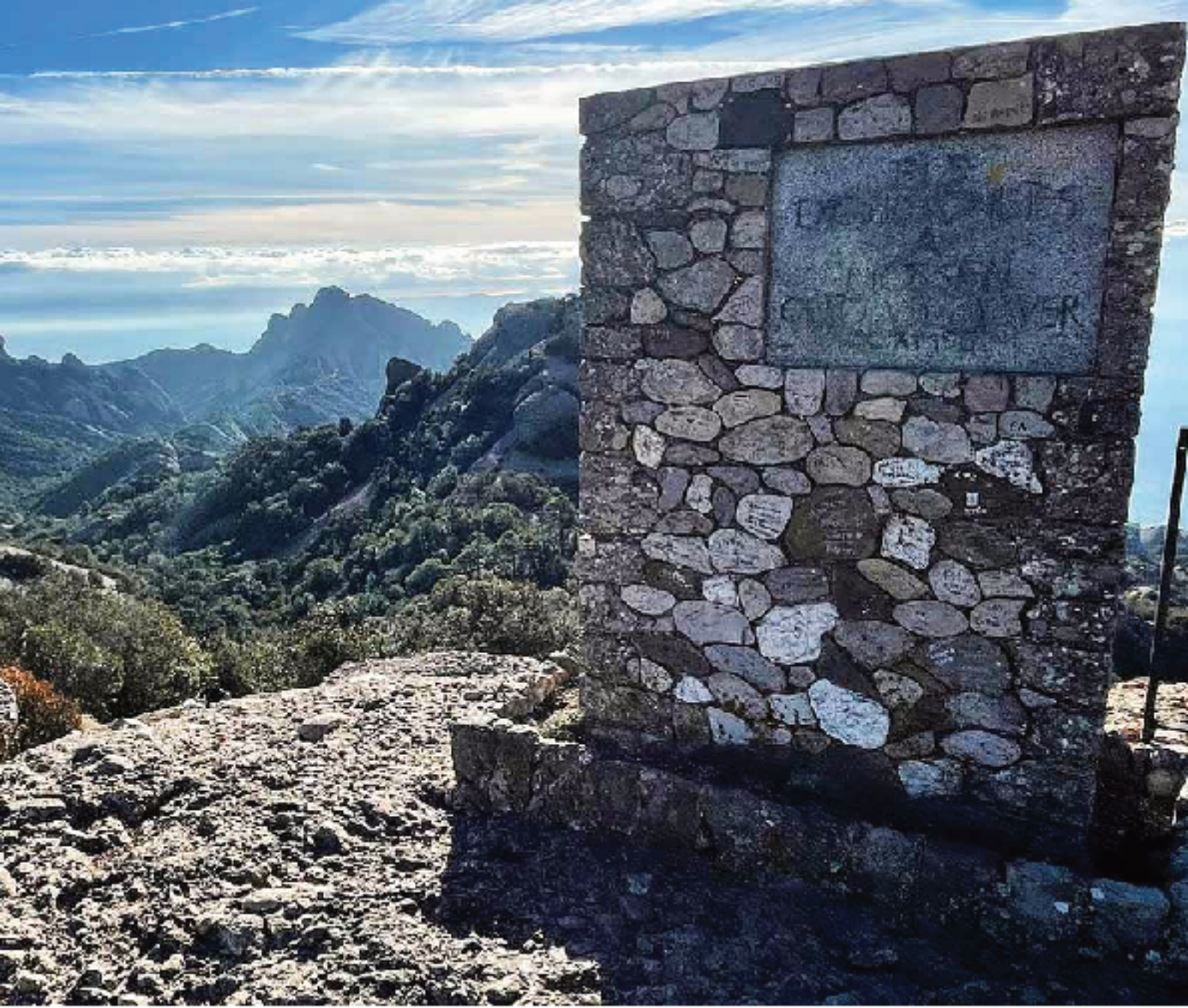
Monumento a Mossèn Orto Verdagué