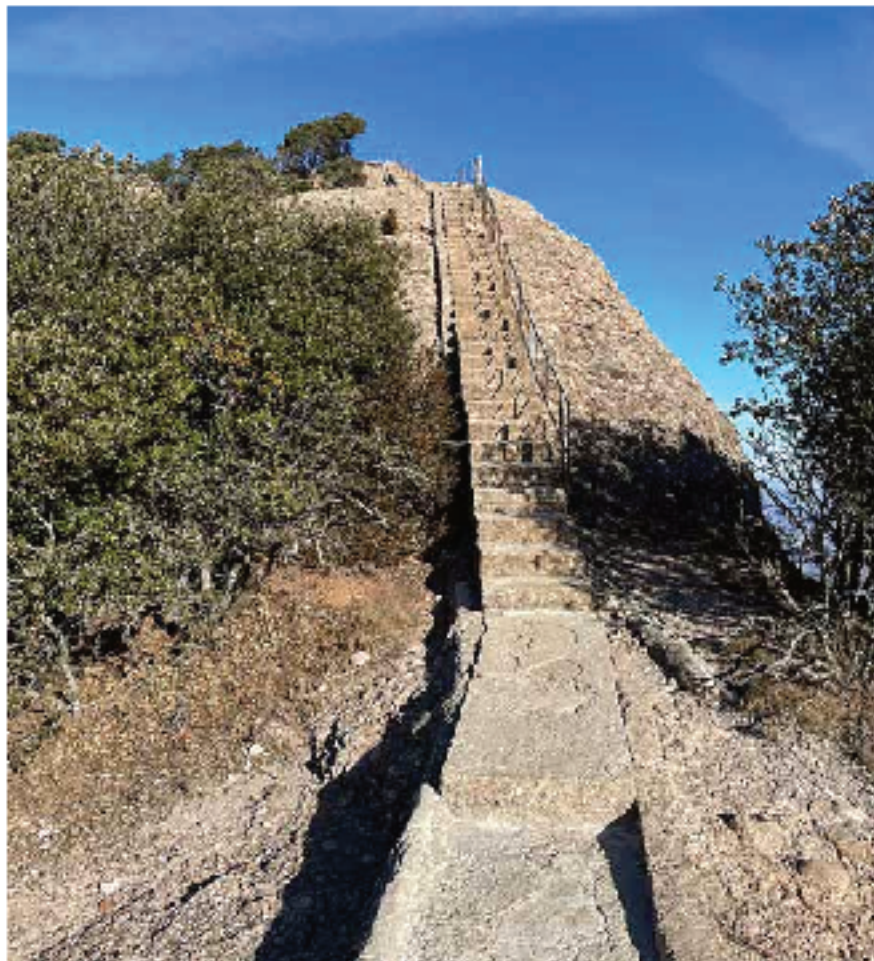
Escaleras a la cima de Sant Jeroni

Les Pinasses es otro cruce de caminos donde podemos ir a la Albarda Castellana o seguir el sendero que, en breve, nos deja en el Camí Nou de Sant Jeroni, un sendero amplio que tomaremos en dirección norte. Subiré a la cima de Sant Jeroni (1236 m), que también es una de las 100 Cims de la FEEC por las escaleras. Sí, sí como lo leéis, hay un tramo de escaleras para acceder a la cima más alta de Montserrat. Me asomo al vacío por donde subía la antigua vía ferrata Teresina y, después de estar un rato tirando fotos al mirador, a la mesa