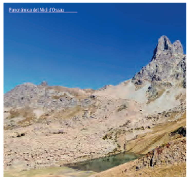
Panorámica del Midi d'Ossau

Aunque la paz que transmite la cumbre provoca la sensación de que el trabajo ha concluido, debemos tener bien presente que nos enfrentamos a un retorno largo y laborioso. Después de destrepar la arista del Petit Pic hasta alcanzar el collado, regresamos a la civilización donde nos aguarda un merecido descanso.