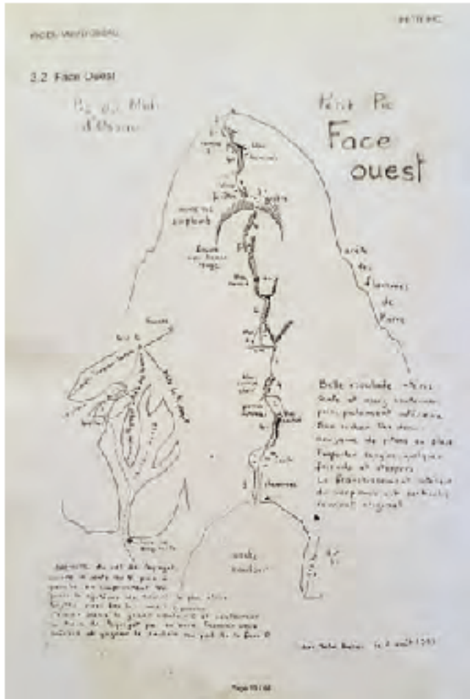
Croquis de la cara Oeste del Petit Pic (1999)

indica una dificultad de V grado. Unos bellos movimientos y una buena colocación de pies nos conducen a la terraza que nos servirá a la perfección para establecer la reunión que da paso al largo clave de la vía: el paso de la cueva. Por encima de nuestras cabezas observamos un mosaico formado por líquenes de todos los colores que, además, resultan de gran utilidad para la orientación porque son la referencia que aparece reseñada en la descripción original de la vía.