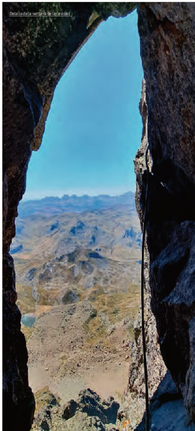
Detalle de la ventana de la cavidad