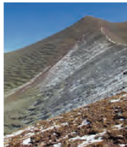
Variante norte del Didi Abuli

La mañana del miércoles 28 vuelve a ser espléndida. No hay ni una sola nube en el cielo y la silueta del cono volcánico preside el horizonte. Dejo la tienda a las 7 en punto de la mañana y afronto las primeras pendientes con la vista puesta en un vallejo