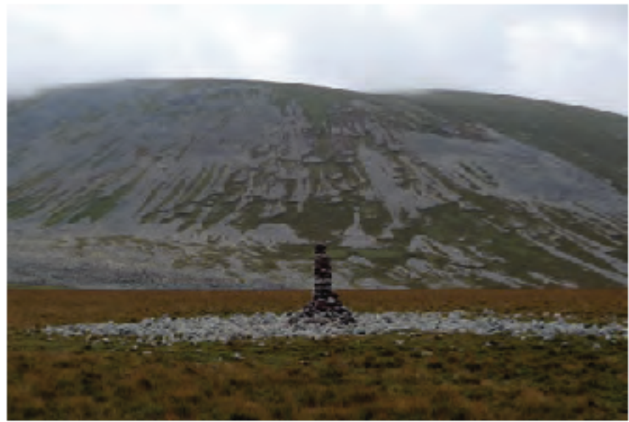
Caminando entre volcanes

Montañas no faltan en Georgia, todo lo contrario, pero si lo que buscamos es evitar el turismo de masas o los destinos más populares, lo mejor es que nos alejemos de Tbilisi y del Gran Cáucaso y pongamos rumbo al sur, a uno de los macizos que acabamos de mencionar y que, hasta el momento, ha recibido poca o ninguna atención por parte de las agencias y operadores turísticos. La cadena montañosa a la que nos referimos y sobre la que gira el contenido de este artículo se denomina Abul - Samsari o Samsari a secas, y la que sigue es una breve descripción de sus características y una reseña de los itinerarios y visitas realizadas a la misma durante los años 2015, 2016 y 2022.