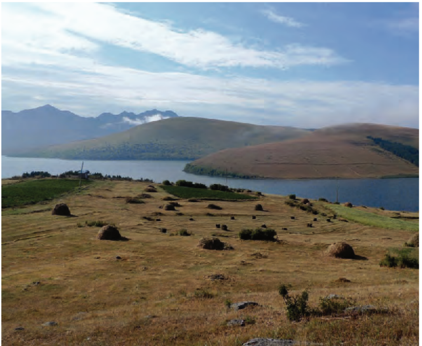
Amiars/metas junto a la aldea de Molit

3285 del Samsario los 3188 del Godorebi, lo cual no tiene nada de particular si tenemos en cuenta que la meseta o el zócalo sobre el que se elevan ronda los 2000 m. De cualquier modo, su aspecto, ya sea viniendo de Borjomi y Bakuriani a través del paso de Tskhratskaro, o desde las orillas del lago Paravani tiene algo de irreal, no parece de este mundo, ya sea por las nubes que suelen flotar sobre ellas o por la transparencia de la atmósfera que las envuelve. La combinación de ambos factores hace que el conjunto adquiera un aire onírico semejante al de esas islas solitarias, misteriosas y erizadas de picos que aparecen en las películas del género fantástico.