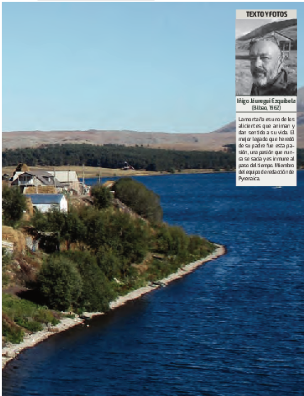
Sierra del volcán Tavkvetili desde Tabatskuri