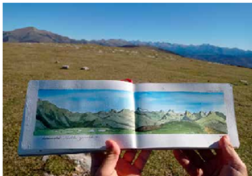
Auhmendak Aboditik.