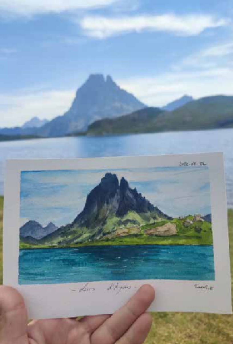
Midi d'Ossau Lacs de Ajousak. EŦAUTAIARTZAGUENA BRAVO