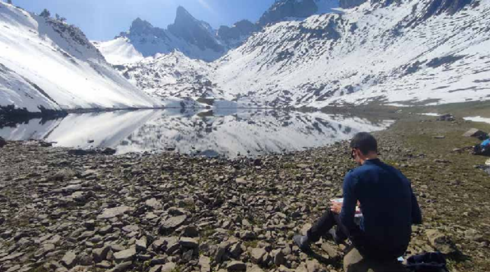
Lac de Lhurs. NAHARRA DA ATUTXA

Bestelako konpainiak ere izan ditut noizbehinka. Bikotes- rekin Aitzkorriko gurutzean geundela, handik dagoen ikuspe- gia margotzen nengibela, ahuntz talde bat hurbildu zitzaigun, hainbeste hurbildu ziren, ia pintzelak jan zituztela. Anxume bihurri bat bereziki egoskortsu zen, gure ondo ondoan bazkatu nahi zuen. Murgil menditik Herriko margotu nuenen zaldiak izan ziren motxilan mutur asartzeraino gerturatu zirenak. Bi- sita bereziak inondik ere. Azken batean, mendian lasai zaudela ingurura behatzesak horie ere badakar, hainbat toki zein bizidun ezagutzes. Mendizale bat baino gehiagorekin topo egin eta elkarriketa xelebreen lekuko ere izan naiz. Kurutzeta mendi- ko tontorrean bikote bat lur etaiko Zaldai Mendi Taldean urte- ro antolatzen dugun mendi eronkarako argazkia ateratzen zebilen, antolatzaileetako bat alboan zutela ohartu ere egin gabe. Neure burua pozarren eskaini nien argazkia ateratzeko, eta mendiaz gozatzen jarraitzeko animatu nituen. Bisaurineko gailurrean, akuarela lan bat erosi nahi izan zidan euskaldun batek, eta Senda de Camille ibilbidea bakarrik hasi nuen arren, akuarelen aitzakian bidean gelditu ziren mendizale batzuekin topo egin eta taldekoan amaitu genuen bides.