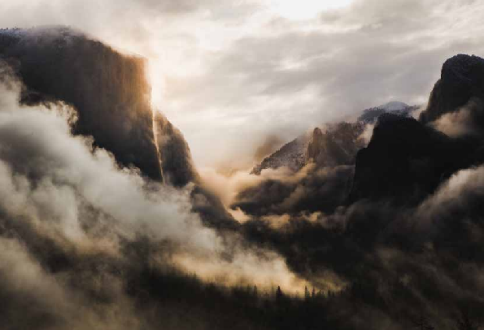
Yosemite egunsentian, California